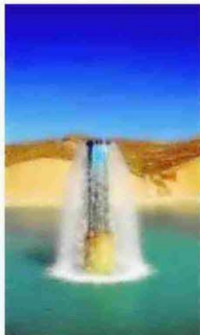
Agua desaladora Carboneras.

Fue hace ya casi seis años cuando se establecieron las conducciones necesarias para que la desaladora carbonera pudiera abastecer a hasta diez municipios de la zona norte de la provincia. Sin embargo, lo que ha estado 'en el aire' es el precio que finalmente tiene ese agua, y el presunto déficit del pago en recibos de la misma. De hecho, el asunto de una subida de precios del agua en la zona del Levante se paró hace ya varios meses ante una 'escalera' electoral que hacía poco factible una medida tan impopular. Algo que, seguramente, deba abordarse más pronto que tarde.