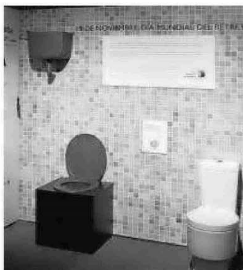
CASA DE LA CIENCIA