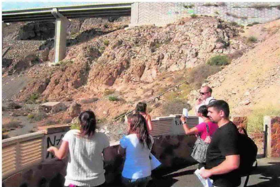
Miembros de IU en una visita al Balcón de Aguadulce hace unos días para hablar con los vecinos.

Para IU, «estamos ante una política continuista donde los más perjudicados son los intereses generales de los vecinos. El PP sigue gobernando a golpe de titular, desplegando una intensa campaña de anuncios y promesas, como si de una campaña electoral se tratara, mientras problemas básicos que afectan al grueso de la población de Roquetas como la elevada carga del IBI y tasas a hogares, el riesgo de desahucios, la mala calidad del servicio de agua, la falta de limpieza viaria o la