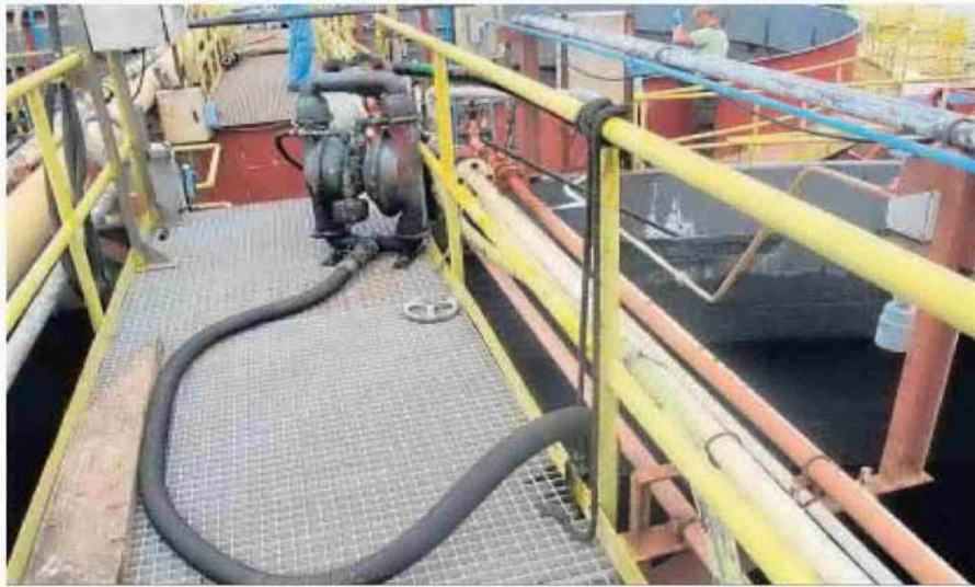
Imagen de Redelsur, tras el recinto de la Guardia Civil.