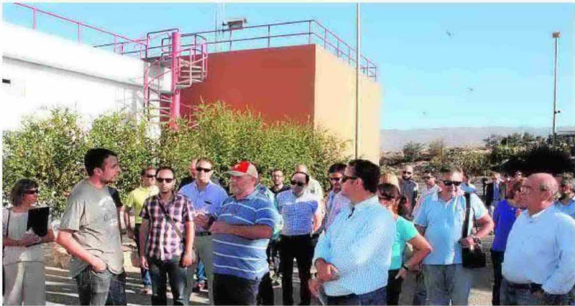
El presidente de Cuatro Vegas guía a regantes en las instalaciones de la comunidad.