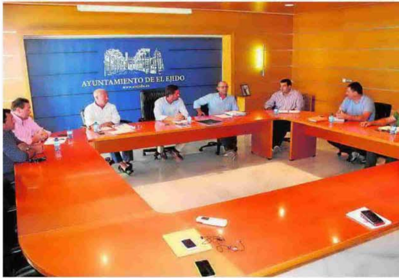
Representantes de Asaja, Ayuntamiento de El Ejido y Coag, en la reunión.

En el encuentro se apuntaron todas aquellas deficiencias que presenta el sector agrícola y que de su solución dependerá el progreso del mismo. No en vano, el objetivo de la reunión, precisamente, fue el de establecer una hoja de ruta en la que trabajar de cara a la presente campaña, con la pretensión de aunar esfuerzos para poder sacar adelante todos aquellos proyectos, medidas o acciones que son necesarios para que la agricultura siga siendo competitiva y líder en los mercados internacionales. Así como el hecho de «ser reivindicativos, también, con las administraciones competentes, en concreto la Junta de