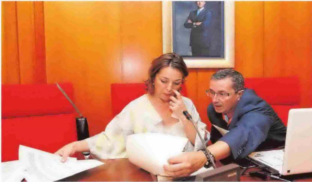
La alcaldesa observa una documentación antes del inicio de un Pleno