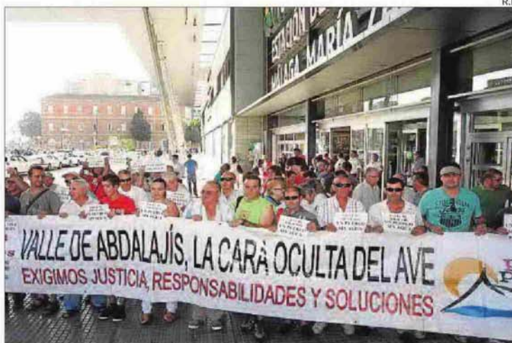
Vecinos del Valle de Abdalajís el pasado año en una protesta.

Otro municipio que dejará atrás los continuos cortes de agua es el Valle de Abdalajís. Sus vecinos olvidarán el calvario pasado desde que en