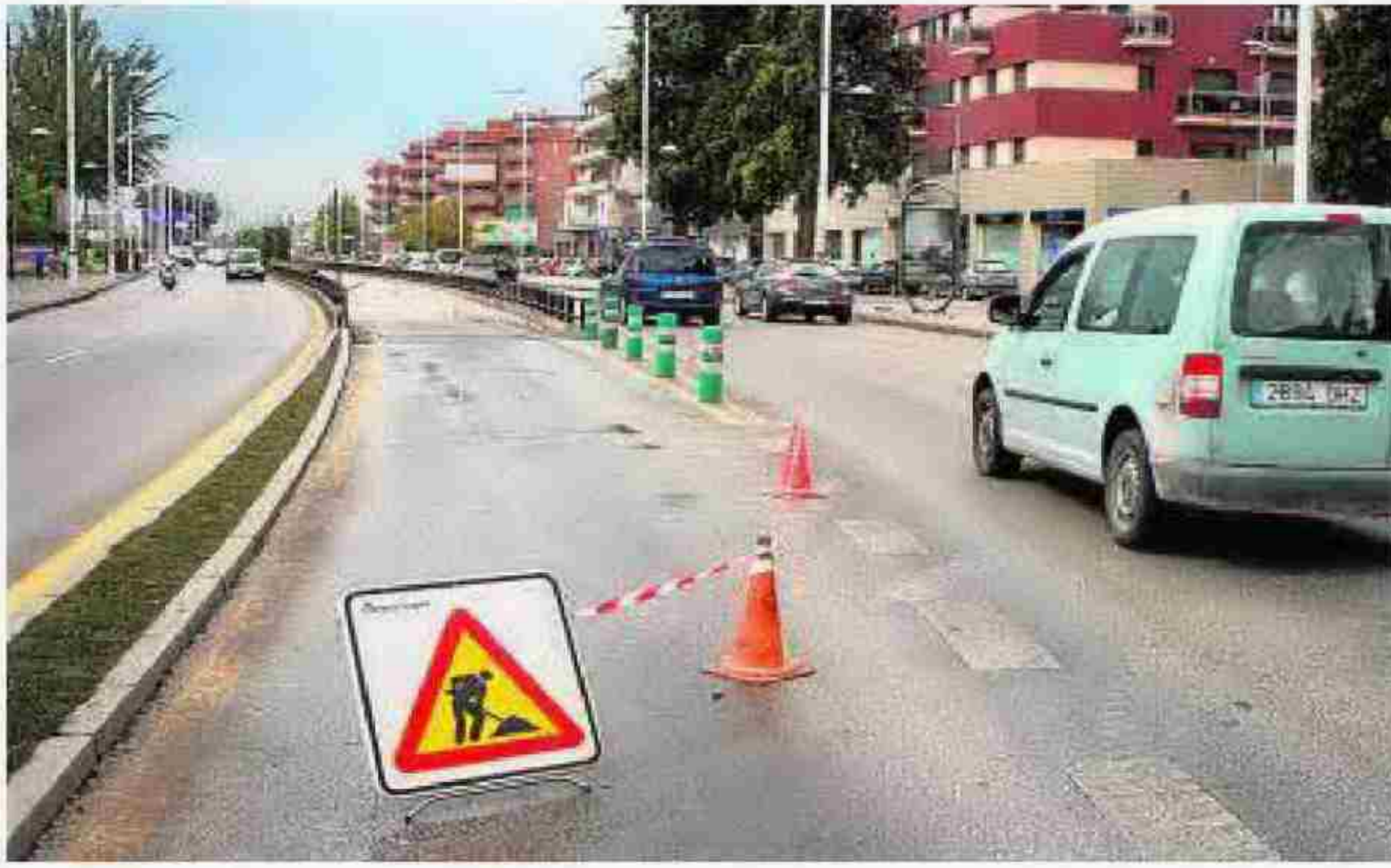
Inundado el subterráneo de la carretera de Armilla.