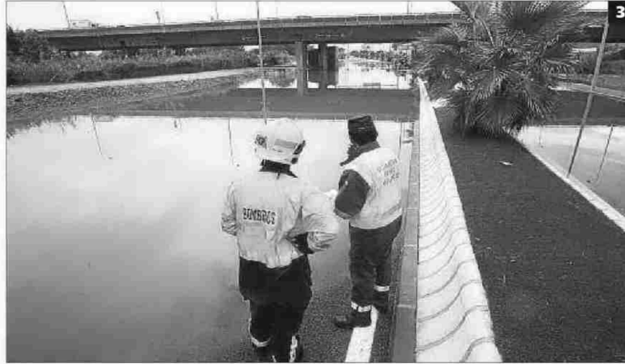
IMÁGENES DE UNA TORMENTA DE VERANO. 1 Una retención en la carretera nacional 340, a la altura del desvío al polígono Guadalhorce. 2 Dos coches atraviesan una balsa de agua en las inmediaciones del aeropuerto. 3 Los accesos al aeródromo estuvieron cortados ayer desde primera hora de la mañana hasta después del mediodía. 4 Una mujer es rescatada por la policía de la avenida García Morato. 5 Un árbol cayó sobre un coche en la calle Ponce de León de Churriana. 6 Las lluvias causaron numerosas incidencias en Alhaurín de la Torre. 7 La carretera que une Torrox y Cómpeta, y la que vincula este último municipio con Algarrobo, de la que pueden ver esta imagen, fueron cortadas. La primera por un accidente y la segunda por desprendimientos de tierra. 8 Uno de los tres caminos que quedaron ayer anegados en Villanueva del Rosario.