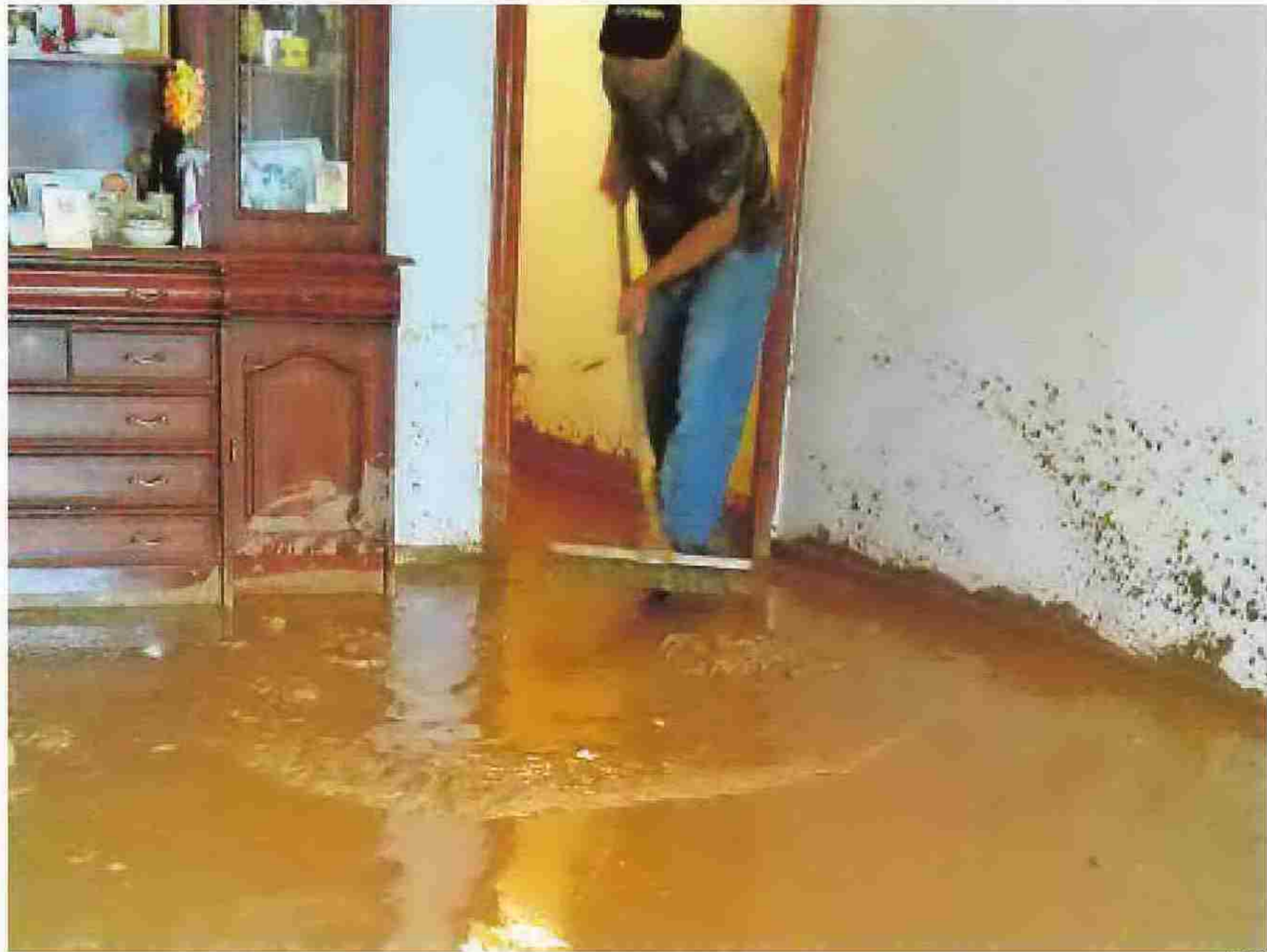
Un hombre saca agua y lodo de su casa de Monturque

En la avenida de las Fuente de las Piedras también se detectaron incidencias varias al llenarse la calzada de lodos, piedras y ramas procedentes de las fincas colindantes que fueron arrastradas por el agua que corría por el cerro de la Atalaya. De hecho en la mañana de ayer los operarios tuvieron que limpiar la vía para que los vehículos pudieran transitar por normalidad en una de las vías principales.