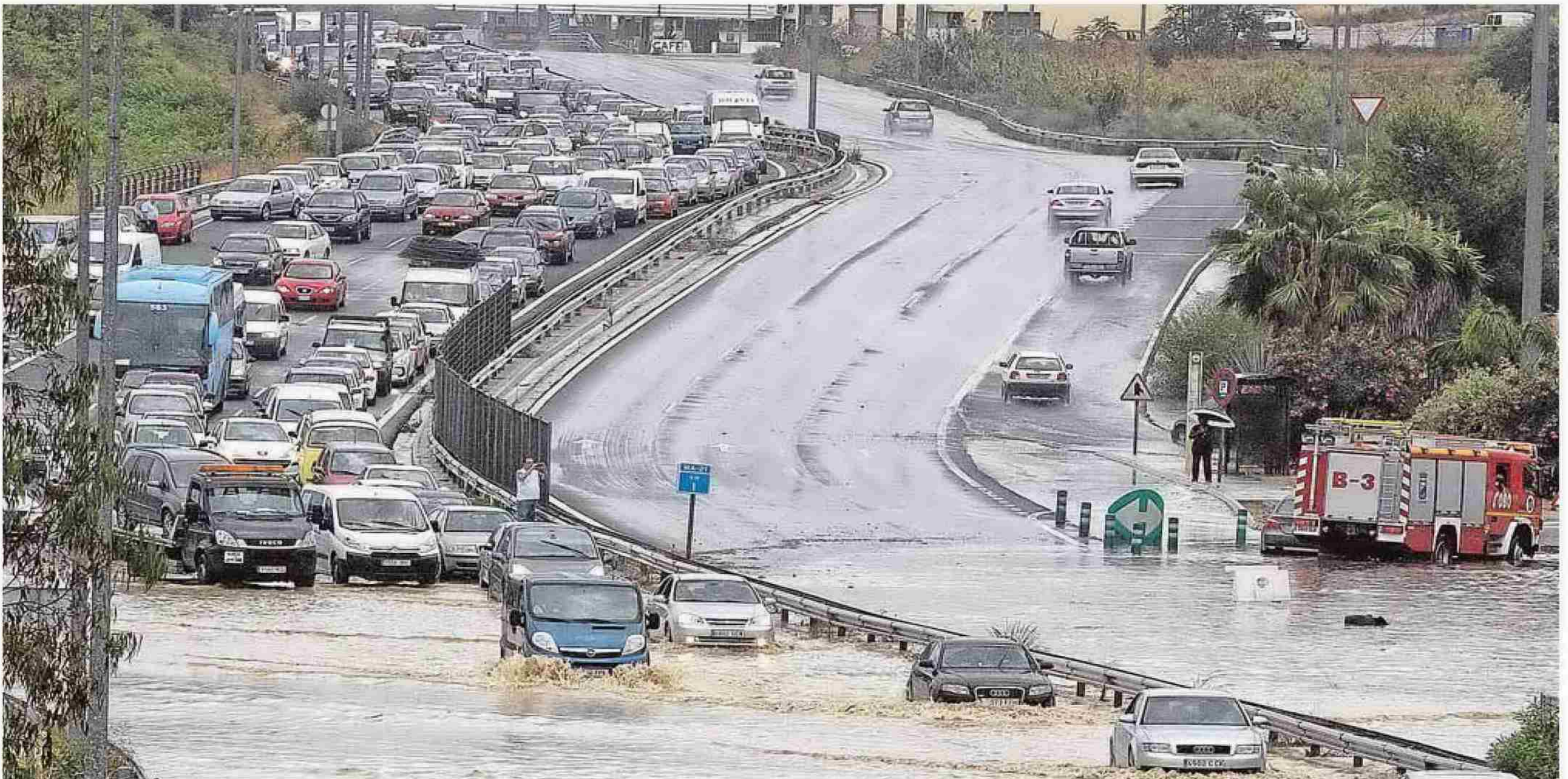
Las graves balsas de agua obligaron a cortar el tráfico en la carretera MA-21, que conecta la capital con Torremolinos.