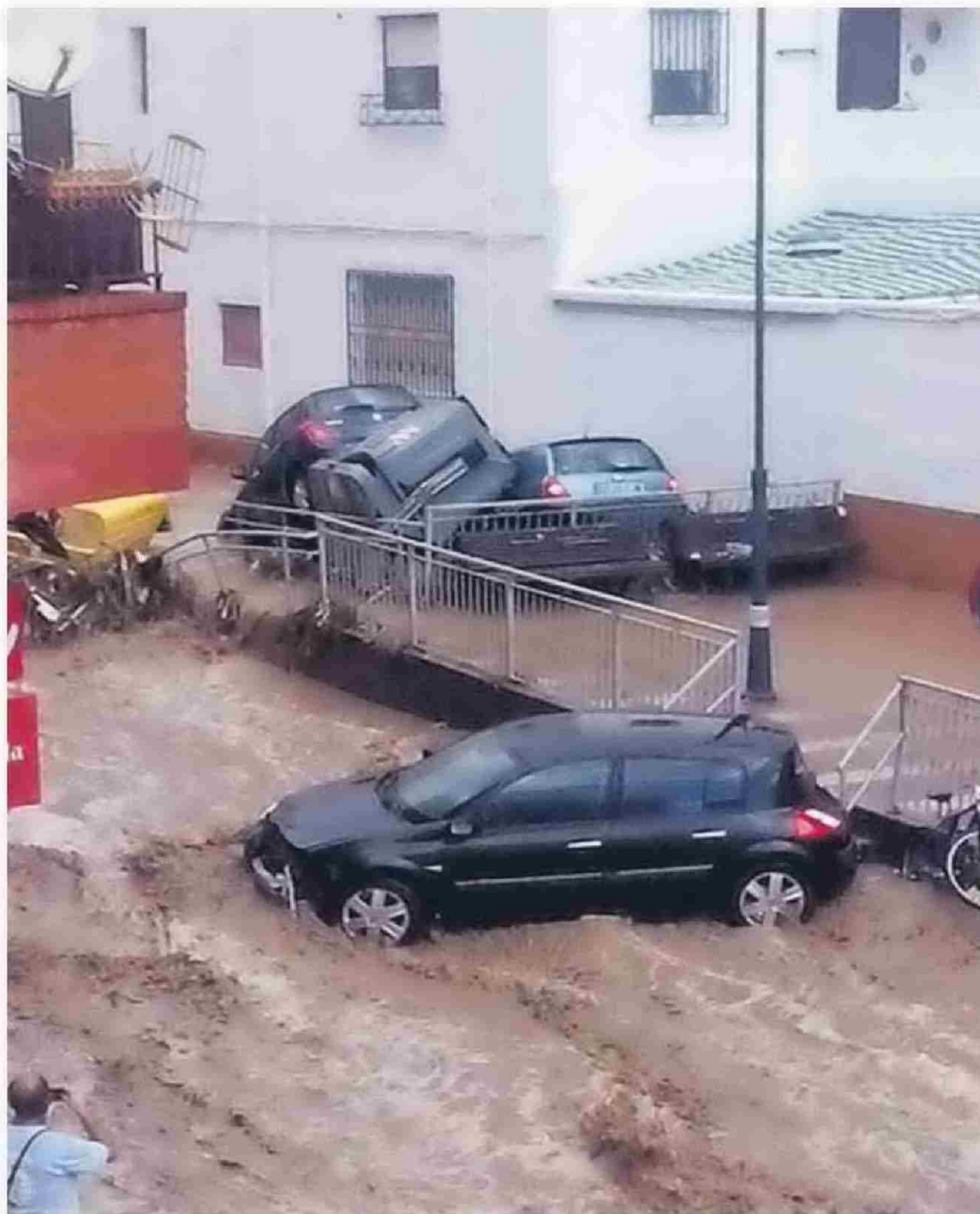
En la localidad almeriense de Adra varios coches fueron arrastrados por la tromba.

De las 327 incidencias atendidas, 259 se relacionaron con acumulaciones de agua; 68 se refirieron a anomalías en servicios básicos y a afecciones en la red secundaria de carreteras por balsas de agua,