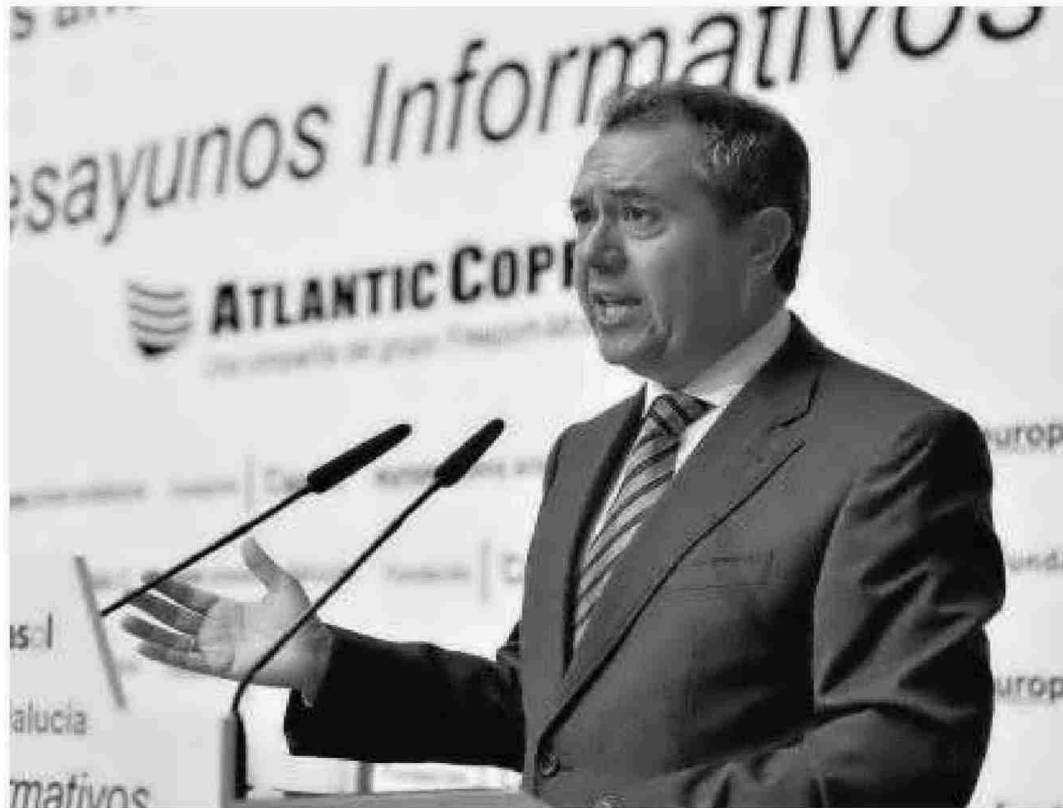
El alcalde de Sevilla, Juan Espadas, ayer en su intervención en el desayuno informativo.

Francisco por Europa Press Andalucía y la Fundación Cajasol, en colaboración con Atlantic Copper, el socialista Juan Espadas justificó este aumento de la presión fiscal a las grandes empresas localizadas en las zonas de más alto valor catastral en la necesidad de introducir un porcentaje de "progresividad en el reparto de la carga tributaria" de "exigir un mayor esfuerzo a los grandes contribuyentes que se benefician ya "al poder deducir en sus impuestos estatales sobre la renta (IRPF e IS) la cuota que satisfacen al Ayuntamiento por el IBI y, en general, por los impuestos municipales". El gobierno local explica que la Ley les permite aprobar un tipo impositivo diferenciado del general para inmuebles de uso distinto al re-