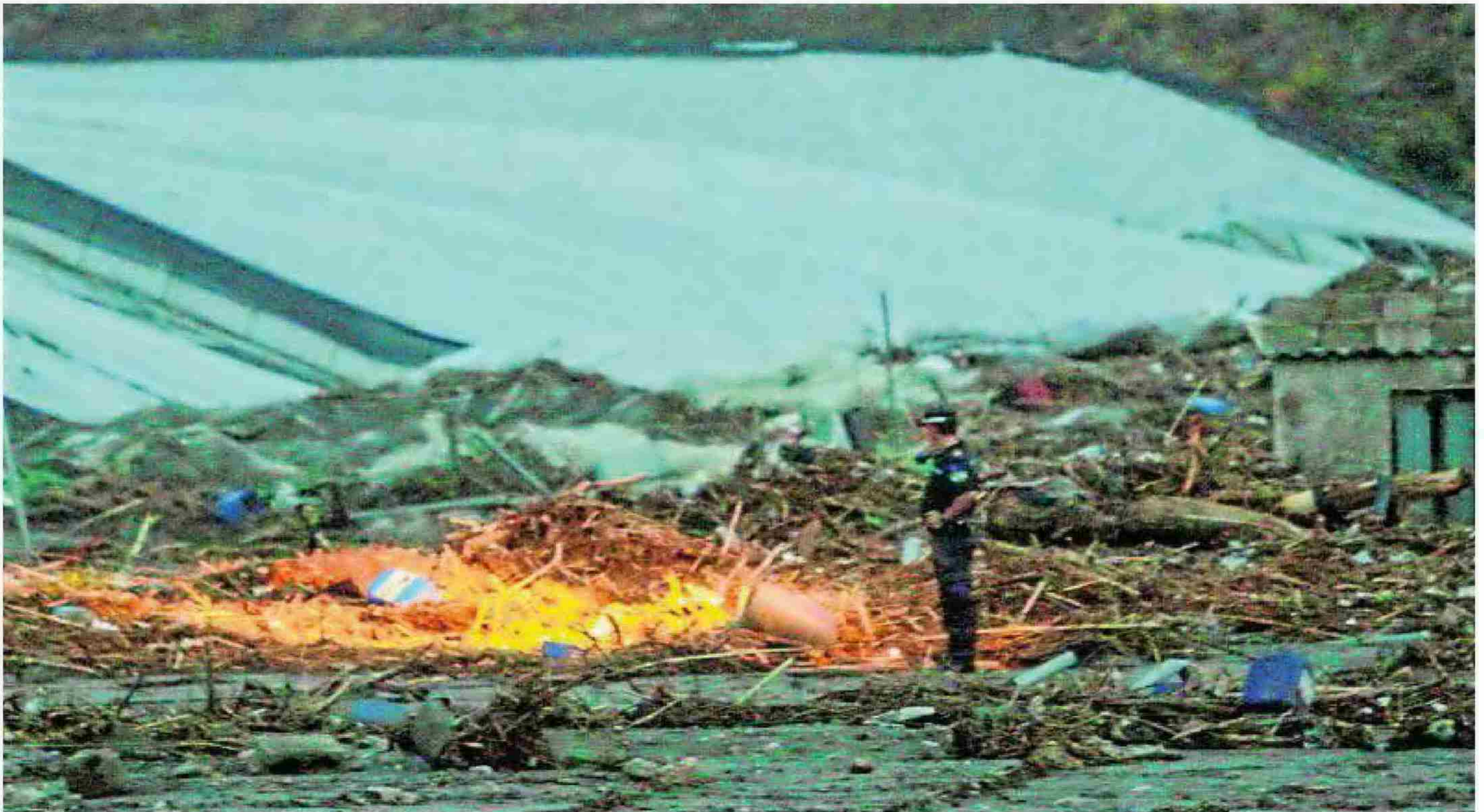
Un particular divisó por la tarde el brazo del segundo fallecido en la zona del Paraje del Pago. :: JAVIER MARTÍN