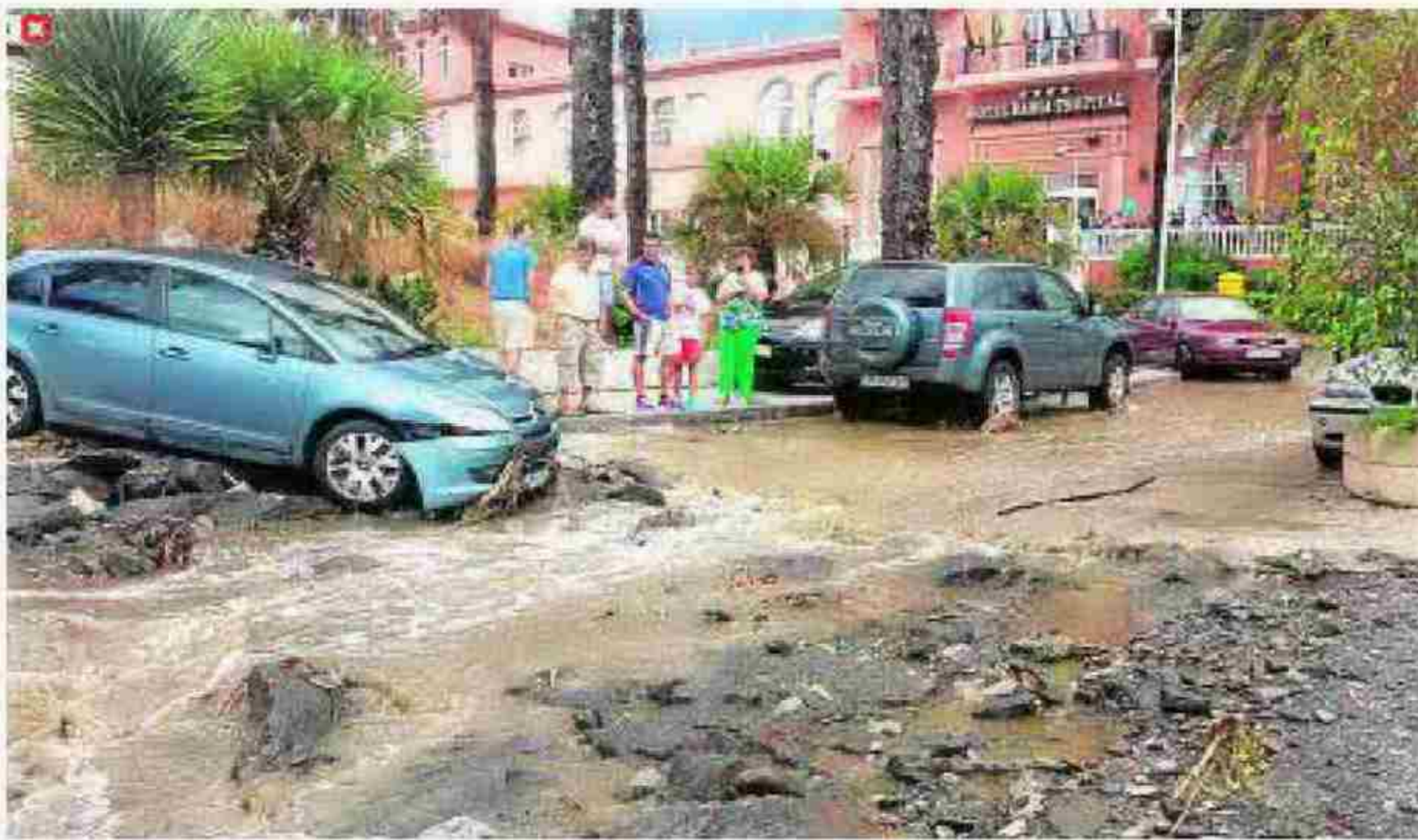
Los efectos de la riada en Almuñécar.