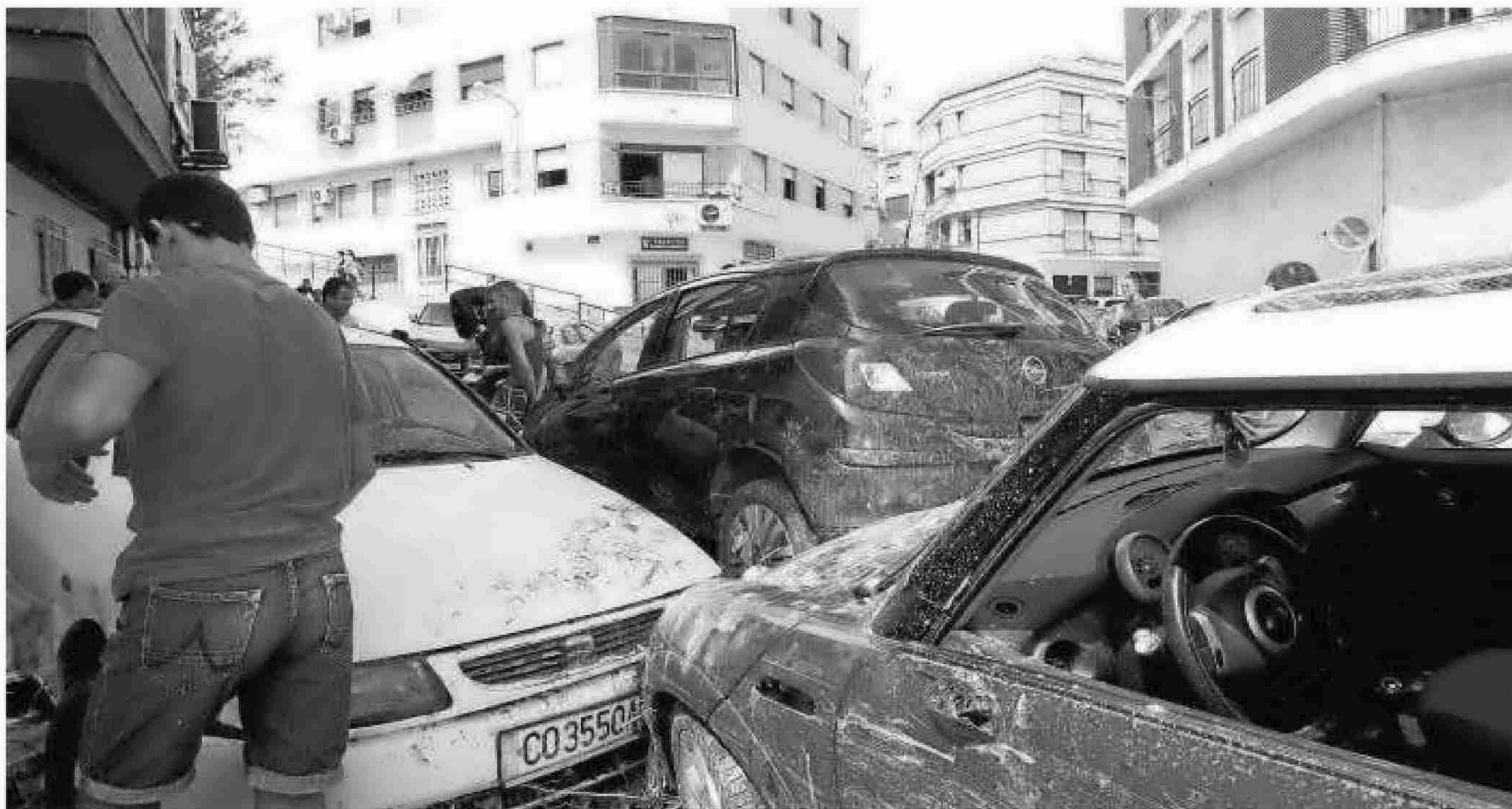
Decenas de coches e incluso camiones quedaron atrapados al final de la calle Natalio Rivas.