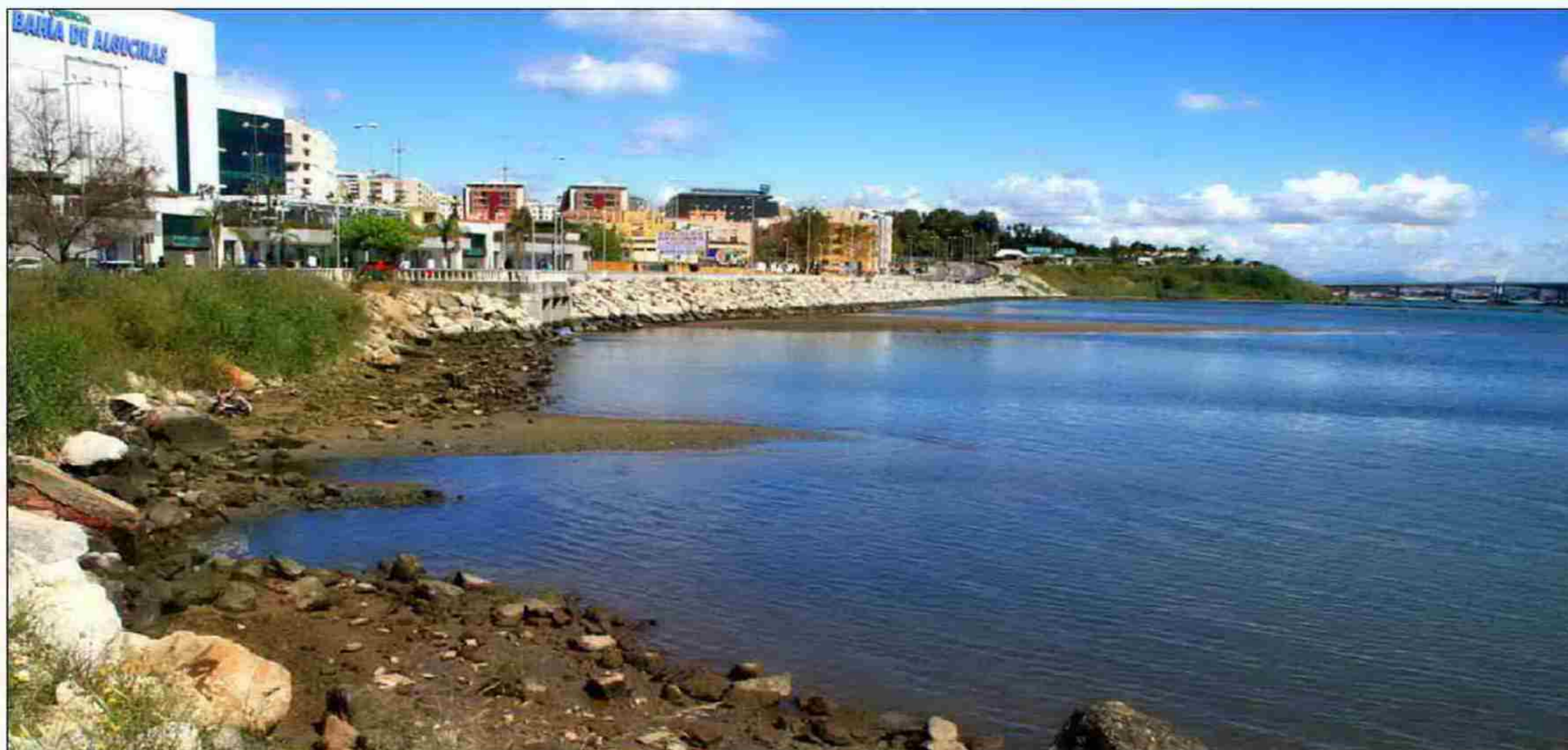
Imagen de la playa de Los Ladrillos