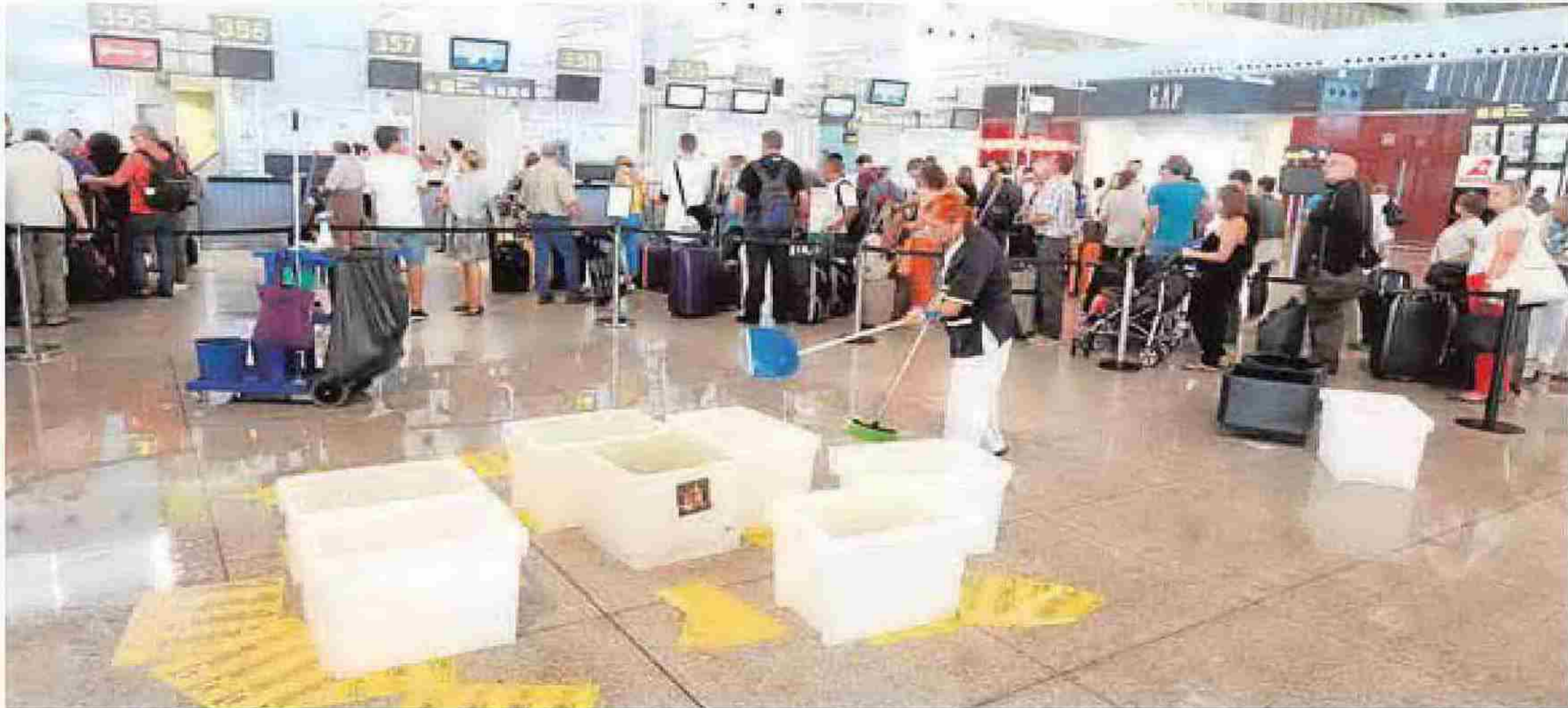
Las goteras anegaron numerosas zonas de la terminal T-3.