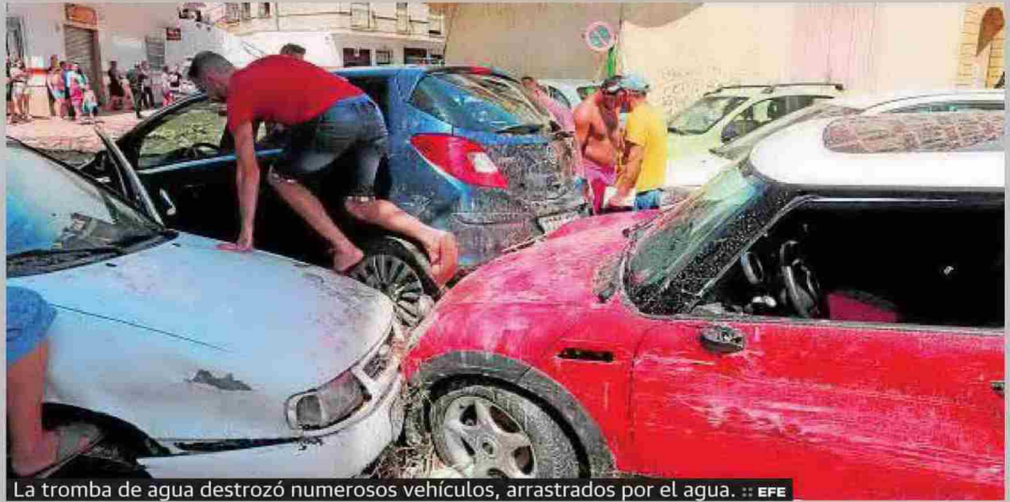
La tromba de agua destruyó numerosos vehículos, arrastrados por el agua.

La tromba de agua afectó especialmente a la Rambla de las Cruces donde se vivieron momentos dramáticos. «He visto pasar desde mi casa y sin control coches, camiones, contenedores... de todo. Nunca había visto algo igual desde el 73», aseguró Encarna, una vecina de esta concurrida calle en la que reside desde hace 45 años.