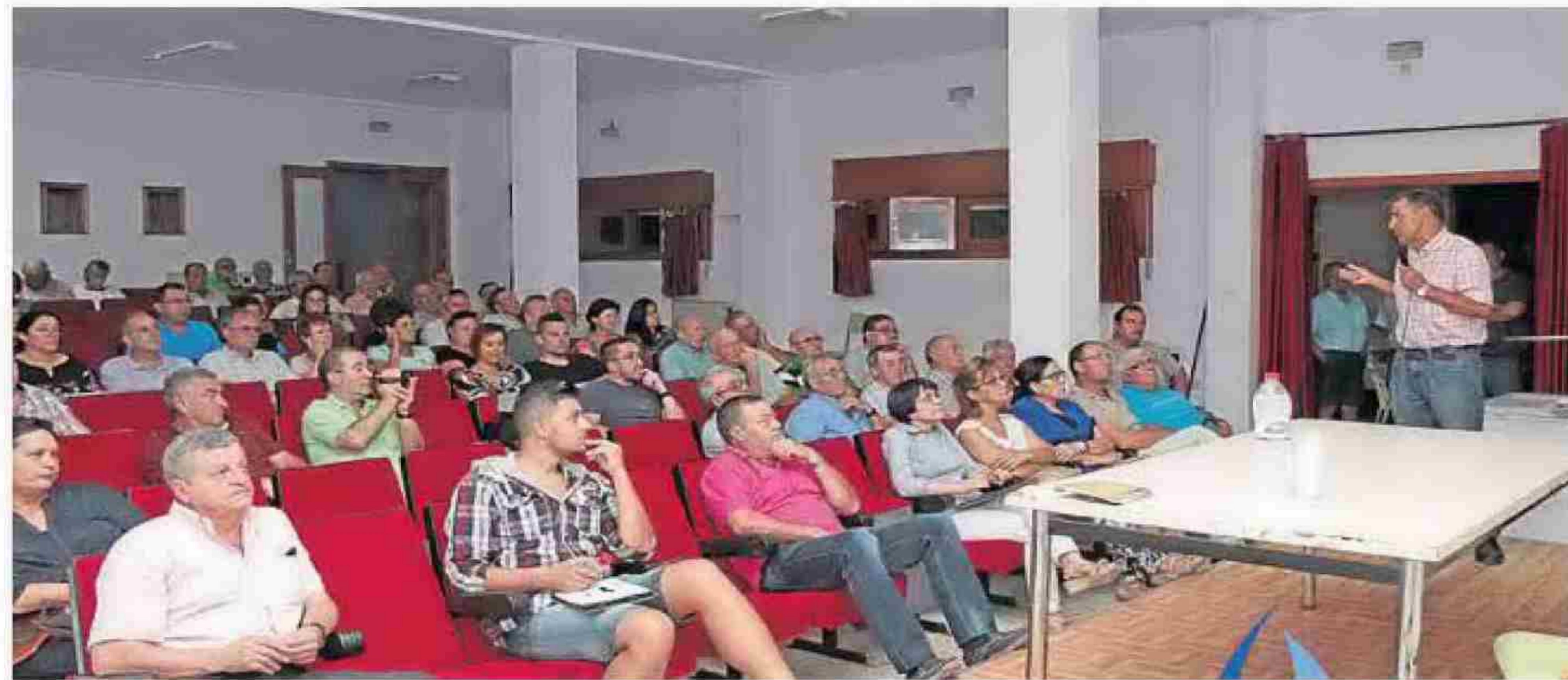
ASISTENTES a la presentación de la plataforma este fin de semana en Vélez Rubio. LA VOZ

Objetivos marcados En sus principios fundacionales reconoce un total de 23 objetivos prioritarios en materia de gestión del agua.