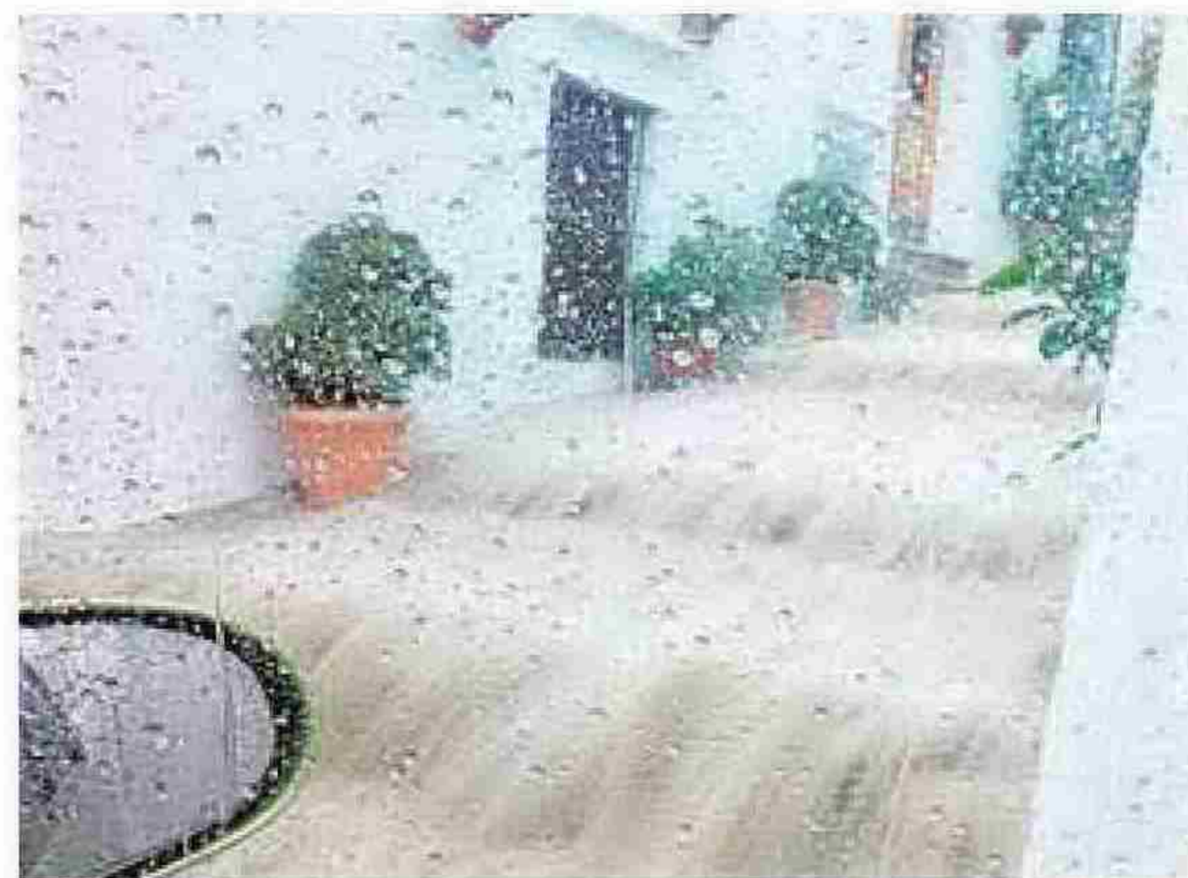
Vehículo atrapado en el acceso al aeropuerto. :: SUR Frigiliana fue un río debido a la tromba. :: E. C.

lluvioso del año 2015 en Málaga, donde la Agencia Estatal de Meteorología toma como referencia provincial histórica lo recogido por el pluviómetro del aeropuerto. Según este dato, las fuertes tormentas han dejado 50 litros por metro cuadrado en esta infraestructura.