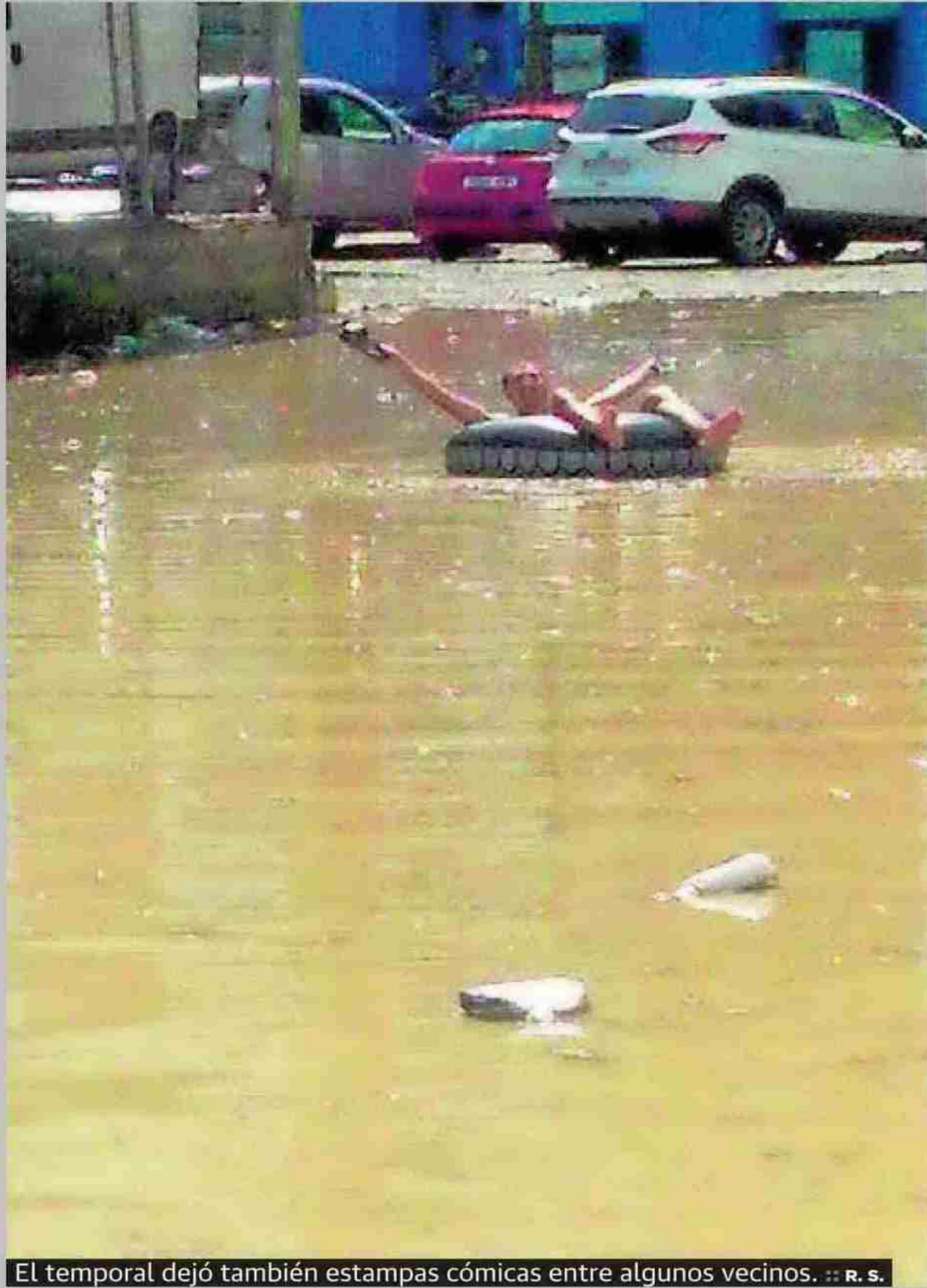
El temporal dejó también estampas cómicas entre algunos vecinos.