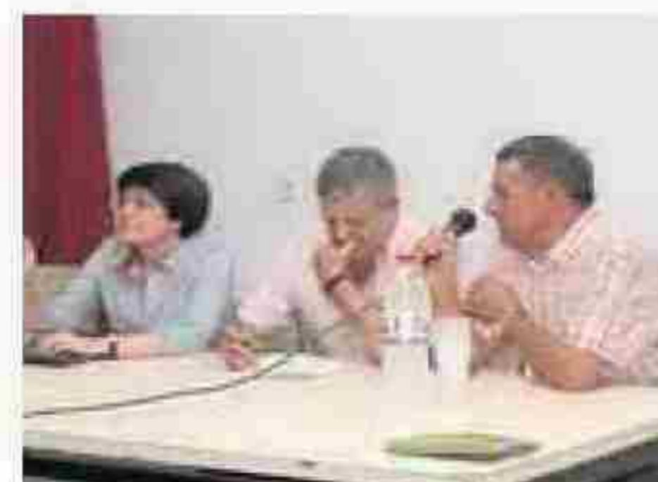
PRESENTACIÓN de los objetivos marcados. LA VOZ

Ecologistas en Acción-Los Vélez, Podemos Vélez Rubio, Izquierda Unida Vélez Blanco, Unión de Pequeños Agricultores (UPA) y la Comunidad de Regantes Aguas de Mahimón ya forman parte de este nuevo colectivo, que ha sido presentado este fin de semana en el municipio de Vélez Rubio.