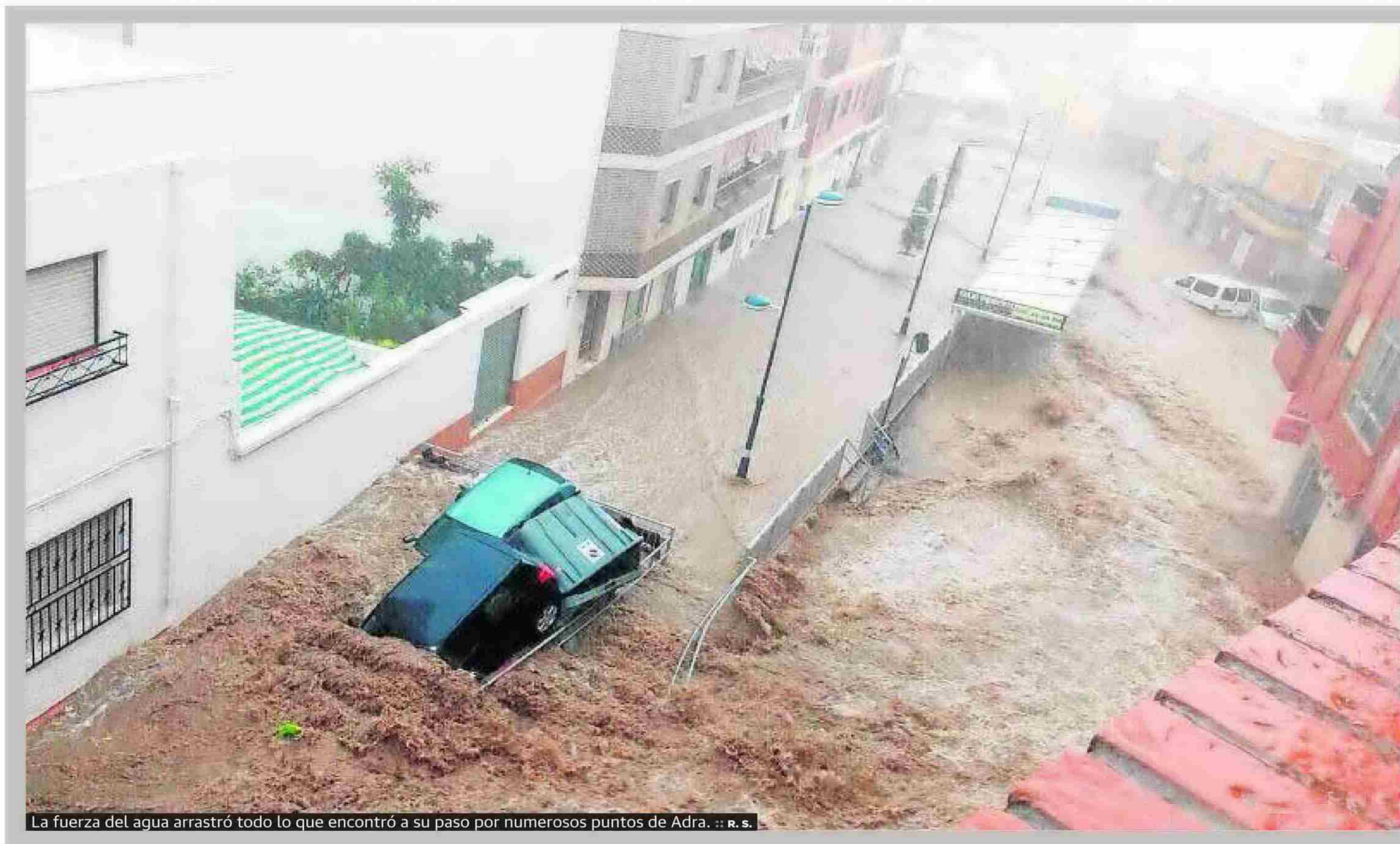
La fuerza del agua arrastró todo lo que encontró a su paso por numerosos puntos de Adra.