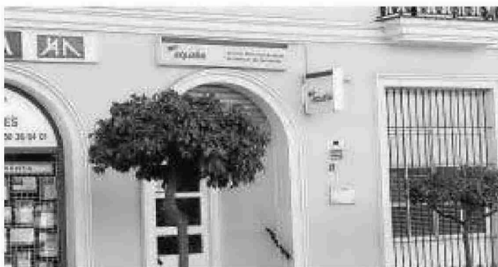
Critican la gestión de Aqualia con la "complicidad" del Ayuntamiento.

Fundamentan su manifestación, entre otros motivos, en "la desastrosa gestión" de Aqualia, la empresa concesionaria de los servicios del ciclo integral del agua en la ciudad, "que permite la no depuración y consiguiente contaminación de las aguas de baño, calificadas este verano co-