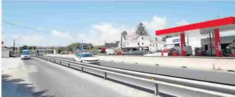
Imagen de la zona donde el Consistorio señala que existe el problema de atasco del canal, ayer.