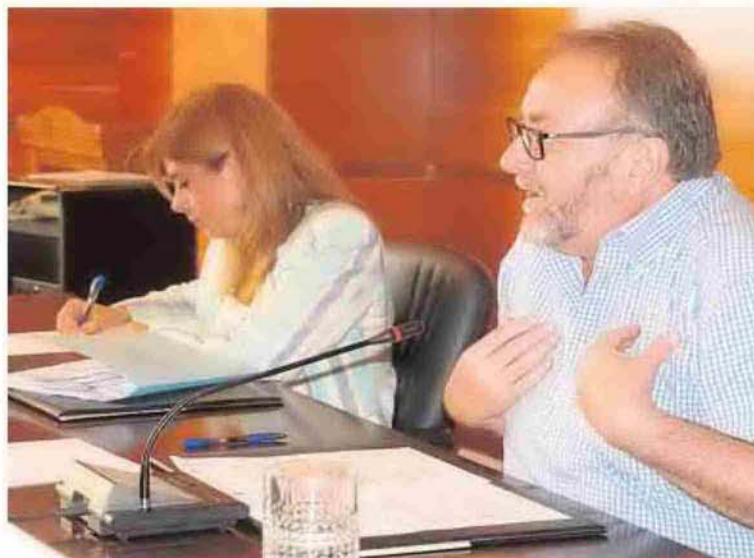
Villanova se despachó ayer contra la Junta de Andalucía. ∴ I. G.

El también diputado nacional y presidente del PP local describió como «vergonzoso» que la Consejería de Medio Ambiente haya afirmado que en la actualidad se está construyendo la nueva EDAR (Estación Depuradora de Aguas Residuales) del Guadalhorce norte (destinada a tratar los vertidos de Alhaurín de la Torre, entre otras localidades), algo que afirma que es «radicalmente falso», ya que apunta que se trata de un proyecto que sigue paralizado después de diez años. «Nosotros desde Alhaurín de la Torre venimos reclamando a través de mociones aprobadas en el Pleno por unanimidad que se acelere la construcción de esta planta y que se busque la mejor ubicación para minimizar su impacto por su cercanía a Mestanza. No solo