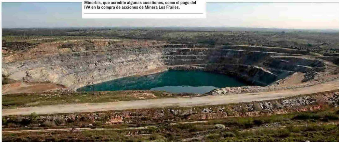
Vista general de la antigua corta del yacimiento minero de Aznalcóllar, inundado y abandonado en los últimos años y tras el accidente que causó el vertido tóxico del río Guadiamar.

En ese mismo auto, cita a declarar el 14 de septiembre en calidad de testigos a J.A.A.G. y M.E.S., encargado y operario de la depuradora de la mina, respectivamente, que estuvieron el 9 de julio con los agentes de la UDEF y la Policía Científica en la visita tras la que se denunció un vertido de agua «altamente contaminada» al río Agrio. Ambos trabajadores –ex empleados de la empresa pública Egmasa integrados ahora en la Amaya, la Agencia de Medio Ambiente y Agua de Andalucía– habrían reconocido que la depuradora no estaba funcionando.