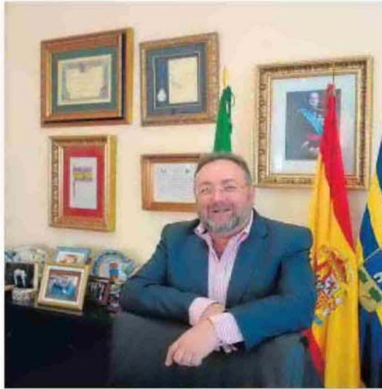
El alcalde de Alhaurín de la Torre

Por tanto, ha criticado que Alhaurín y el resto de ayuntamientos estén pagando el canon “sólo para sostener la política de fachada de la Junta en materia medioambiental”. “Nos obligan a poner en el recibo que los vecinos están destinando ese dinero a invertir en depuración, cuando es mentira”, ha