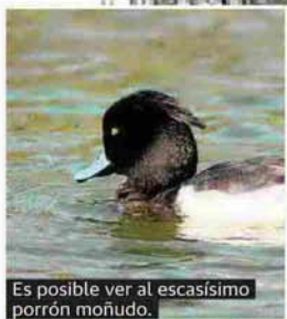
Es posible ver al escasísimo porrón moñudo.

Martin pescador, pescan pececillos para alimentar a