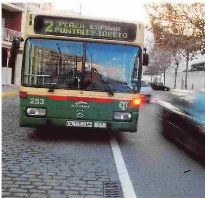
La municipalización de los autobuses tendrá que esperar.

Otro de los puntos que se llevará a Pleno será la prórroga forzosa del contrato de concesión de los autobuses urbanos de la ciudad, que actualmente ejerce la empresa Tranvías. La finalización del contrato tuvo lugar el pasado 15 de julio, pero el Ayuntamiento y la compañía han llegado a un acuerdo para que éstos últimos sigan desempeñando su cometido. Una ampliación que a día de hoy no tiene una fecha límite y por lo tanto se prolongará mientras se sigue analizando la situación. De esta forma, la opción de municipa-