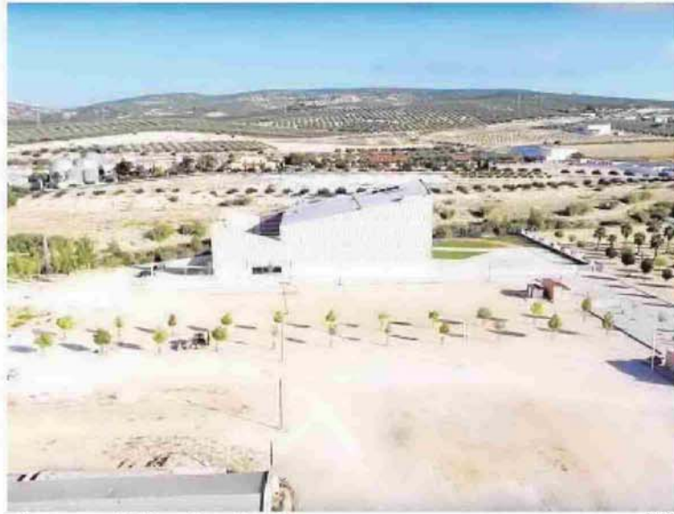
Vista general del recinto ferial