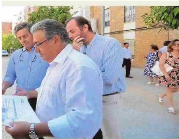
lo de las obras que se realizan en San Carlos, también ayer por la mañana