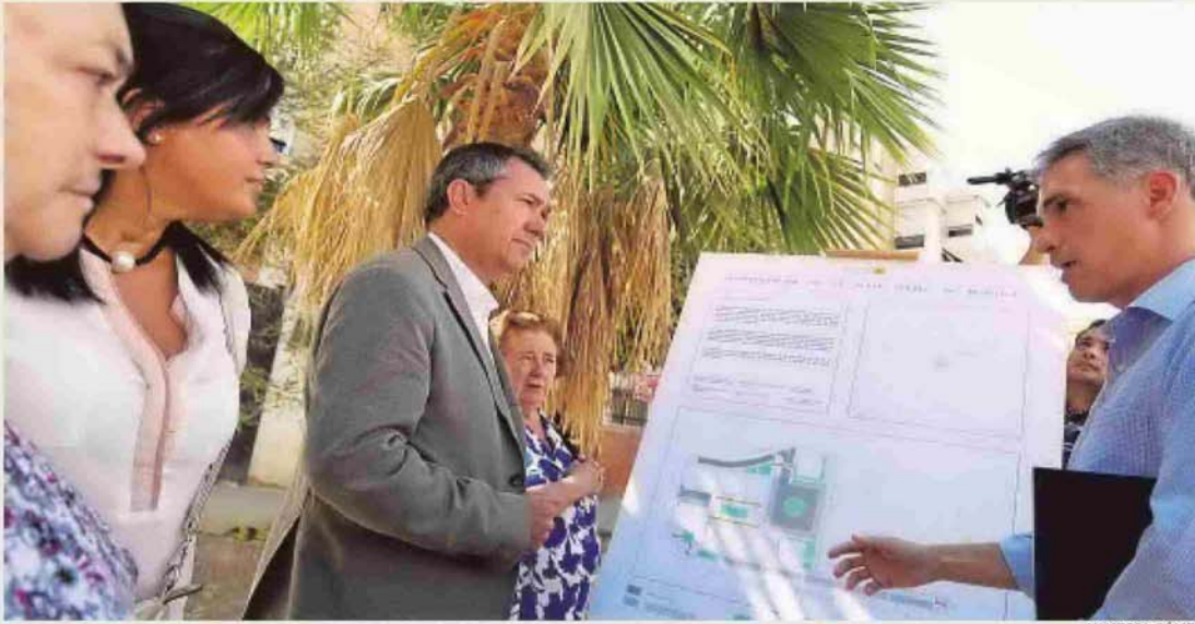
El alcalde, Juan Espadas, explica los trabajos de reurbanización en la barriada San Carlos