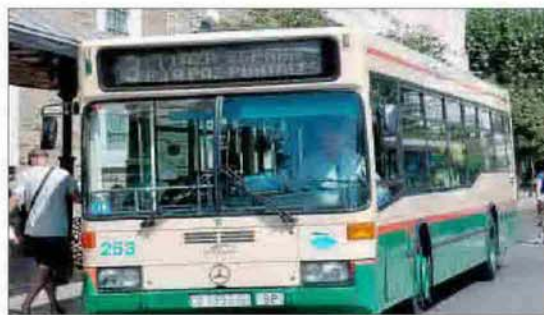
Uno de los autobuses de Cádiz recogiendo a usuarios en una parada.