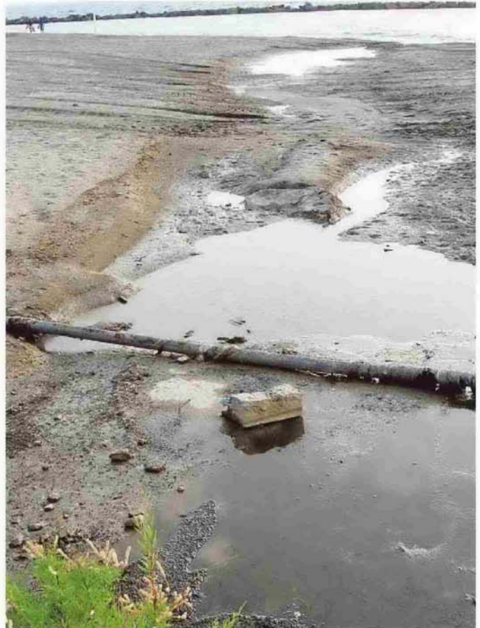
Vertido de aguas residuales en una playa de Almería

Son, según Chocano, licitaciones de los proyectos, y cuando concluya esa