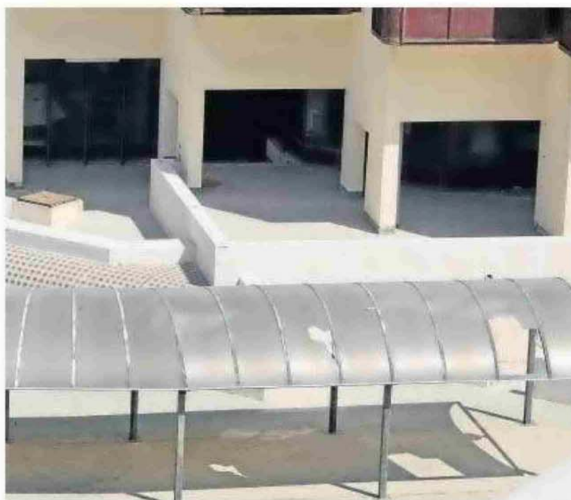
La residencia de Tiempo Libre está a la espera de conocer cuál es su futuro.

Con todo, Vila aprovechó para criticar la postura del PP y del PSOE al presentar sendas pro-