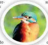
Un Martín pescador, Alcedo Atthis

La pantaneta muestra como pocos kilómetros después de su nacimiento en la sierra de Tejeda, el río Alhama se remansa y aprovecha la presa artificial para generar un singular paraje que la naturaleza ha conquistado para dar cobijo a los habitantes del agua.