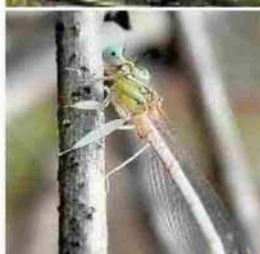
Un raro caballito del diablo, el patiblanco, Platycnemis latipes.