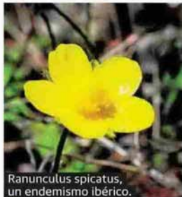
Ranunculus spicatus, un endemismo ibérico.

En la presa del río Alhama la naturaleza ha reconvertido y colonizado un enorme espacio lagunar originado por el hombre