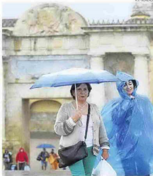
►► Un día de lluvia en Córdoba durante este año.

de los que informa la Agencia Estatal de Meteorología (Aemet) en sus informes presentan un importante déficit pluviométrico que supera los cien litros, llegando a 229 menos en el embalse de Guadalupe (Cerro Muriano), 207,2 menos en Aguilar o 167,6 por debajo de lo normal en Montoro. En el caso de la ciudad de Córdoba, hasta hoy se habían contabilizado solo 471 litros por metro cuadrado, 123 menos de la media acumulada entre 1980 y 2010, que es la que toma como referencia la Aemet. Además, las