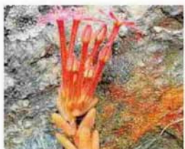
Una planta endémica de la Península, Pistorinia hispanica.

GRANADA. Grupos de cormoranes descansan sobre las ramas de los grandes álamos que crecen apiñados en las riberas del río Alhama. Tienen el plumaje salpicado de trazas blancas y anaranjadas que indican la proximidad a