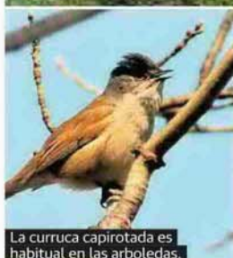
La curruca capirotada es habitual en las arbotedas.