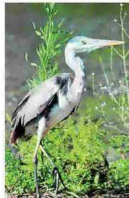
Garza real. Un juvenil de Ardea cinerea entre la vegetación de ribera.