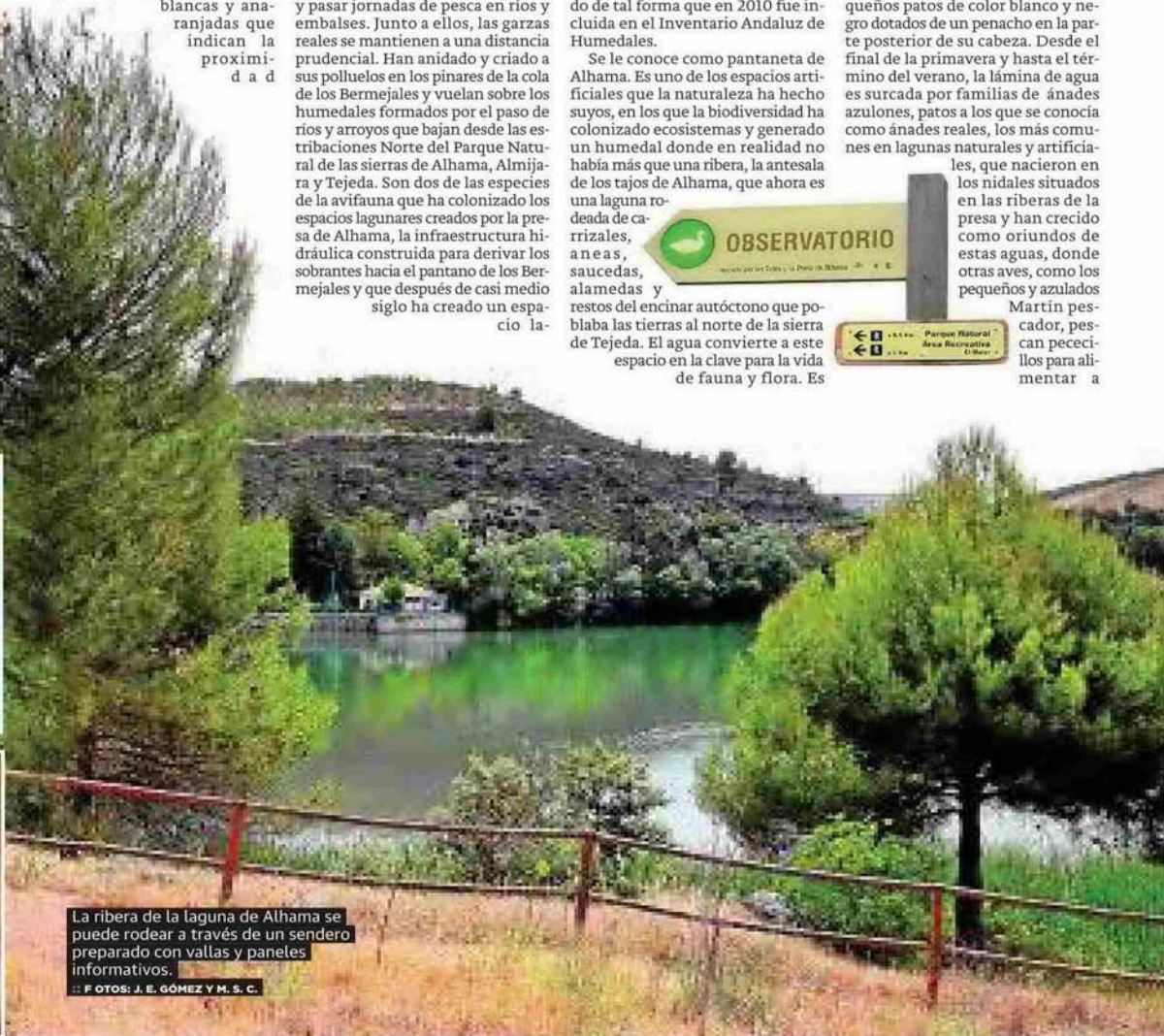
La ribera de la laguna de Alhama se puede rodear a través de un sendero preparado con vallas y paneles informativos.