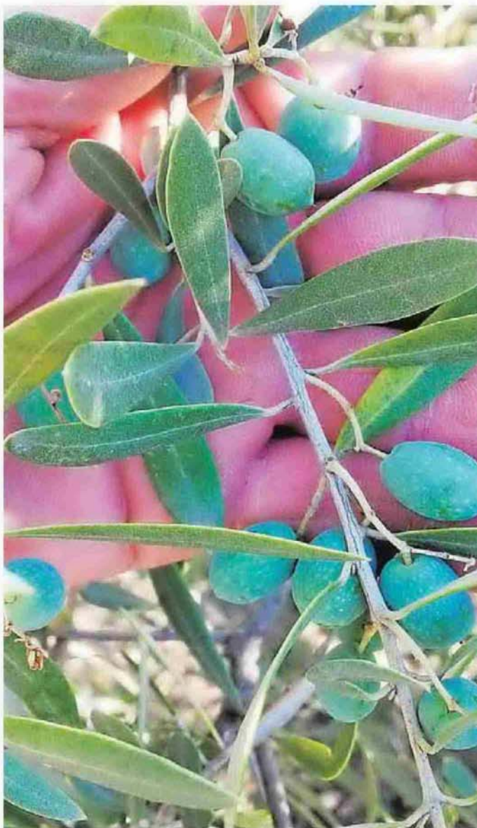
La falta de agua y el calor hace que la aceituna no tenga tamaño.

Según datos del Consejo Oleícola Internacional (COI), la sequía y las altas temperaturas han reducido la cosecha de este año, y Málaga no será ajena a este descenso. De hecho, todo apunta a que la campaña en la provincia será mejor que la de 2014-2015, que se cerró 61.000 toneladas de aceite y 55.000 de aceituna de mesa, pero no tan buena como la de hace dos años (2013-2014), en la que se alcanzaron los 94.000 toneladas de aceite. «Los olivos están sometidos a un gran estrés hídrico, primero porque hemos tenido una primavera con muy pocas precipitaciones y por las diversas olas de calor que está sufriendo el campo malagueño. La consecuencia es que la aceituna es más pequeña de lo habitual y además está arrugada. Ello supone que la cosecha será menor de lo que se esperaba en principio», declaró ayer el secretario provincial de