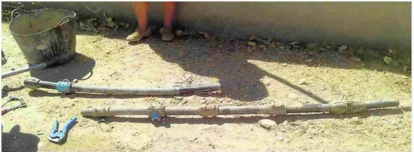
Un tramo de tubería de abastecimiento de la red turrera muestra cuántas veces ha sido reparada la misma, en un metro, cinco empalmes.