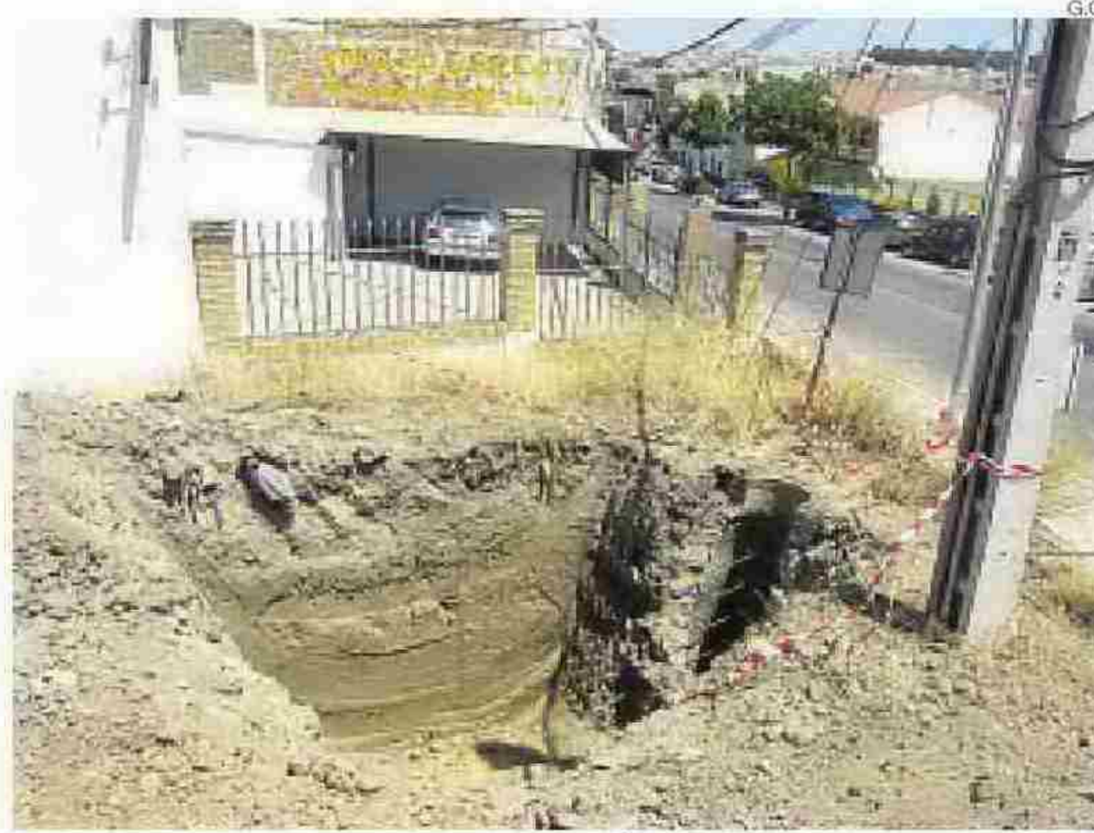
Las obras se han iniciado en la calle Estepa de Puente Genil.

se pueda abastecer de agua a la aldea de La Mina y a la urbanización de Las Palomas, sin tener que utilizar el pozo de Pintamonas, instalándose además una bomba elevadora, dado que el punto de conexión está más bajo de donde se suministraba el agua. La previsión que maneja el Ayuntamiento de Puente Genil