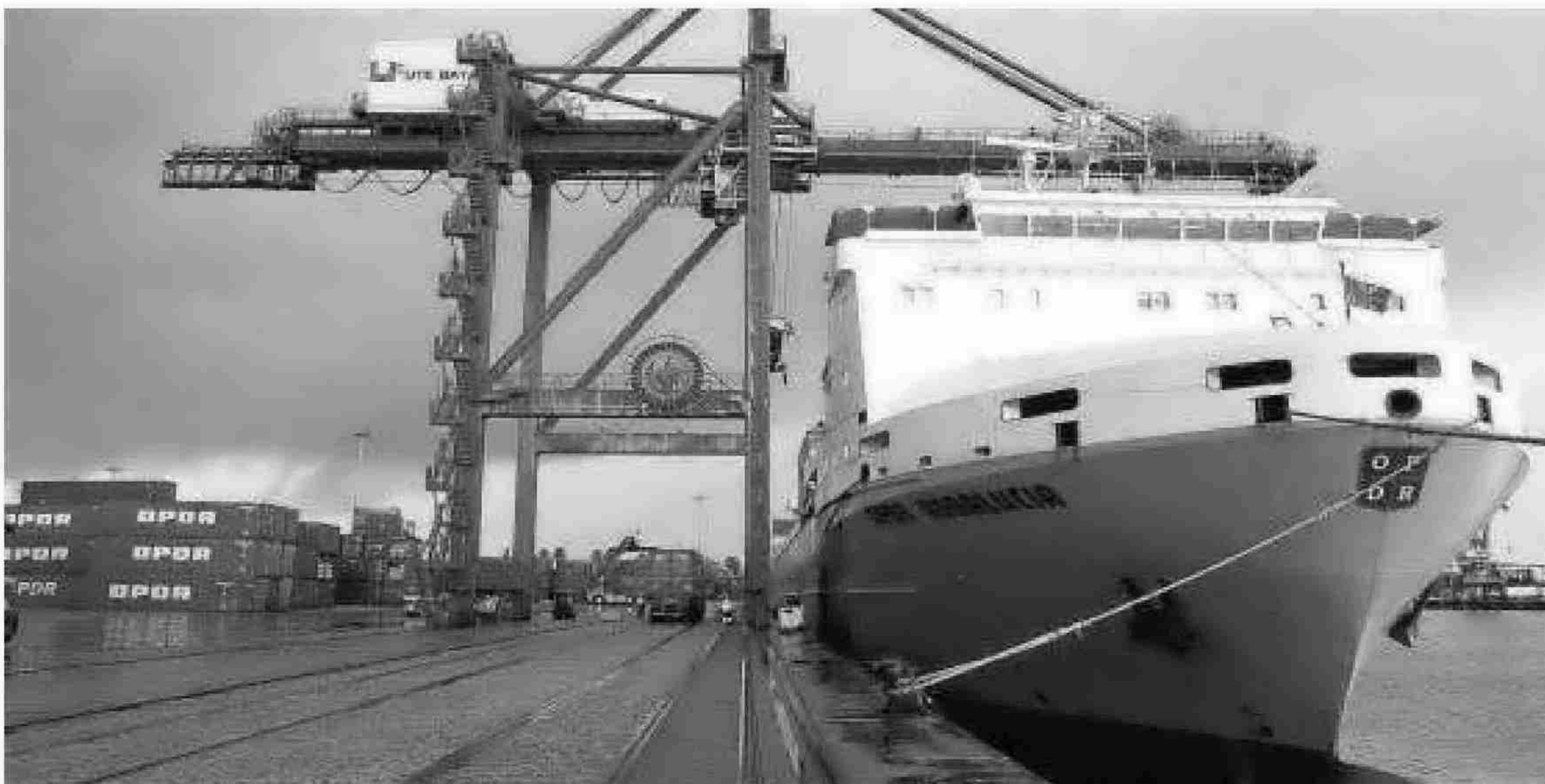
JOSÉ ÁNGEL GARCÍA

Un barco de mercancías atracado en el muelle de contenedores del Puerto de Sevilla.