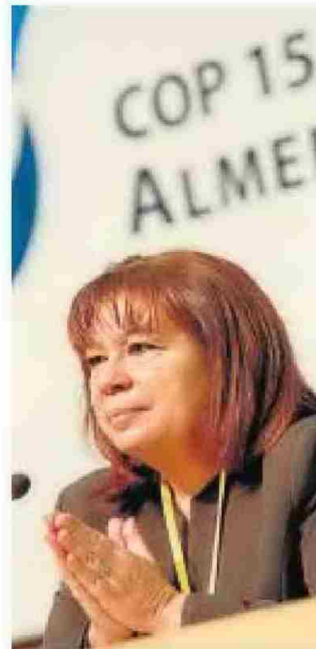
Cristina Narbona, ex ministra.

La ex ministra socialista en la etapa de Zapatero advierte que sería “una mala noticia” que Doñana perdiera el título de Patrimonio de la Humanidad. “Conservemos el Parque Nacional Doñana, es una auténtica joya ecológica y reconocida a nivel internacional”, reclama. Recuerda que España casi pierde el reconocimiento de las Tablas de Daimiel al quedar el paraje sin agua tras una sequía prolongada y una larga extracción de los