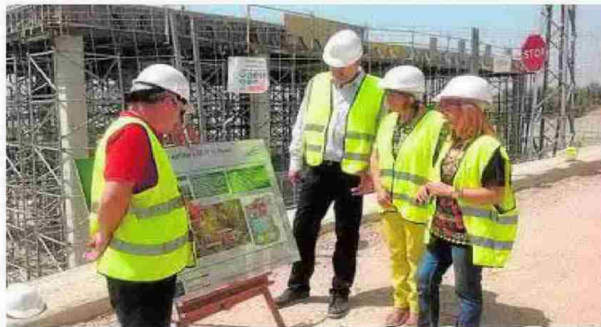
Visita a las obras de la depuradora de Úbeda.

La planta, que tendrá capacidad para asumir un volumen diario de 12.696 metros cúbicos de agua, funcionará mediante un sistema de aireación prolongada con línea de tratamiento de fangos, contando para ello con dos líneas de tratamiento