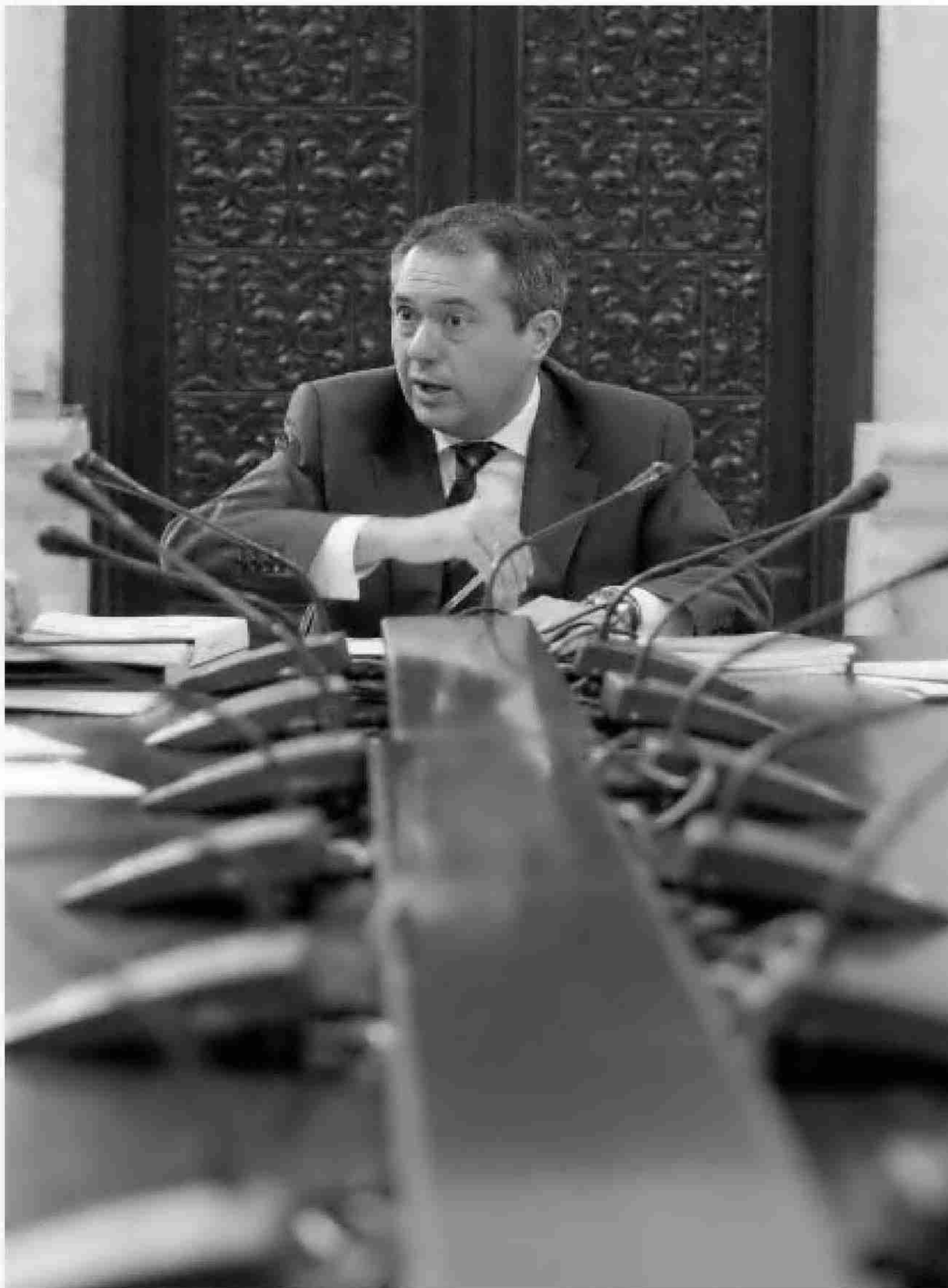
El alcalde, Juan Espadas, ayer en la sala de gobierno del Ayuntamiento.

Se requiere ser funcionario con categoría A o titulado superior con un informe de idoneidad para las funciones encomendadas. El currículum de cada director general deberá ser público, de acuerdo con lo pactado en los acuerdos de investidura del alcalde. Espadas apuesta por crear un segundo escalafón fuerte y profesionalizado. Hasta ahora había 14 directores generales con sueldos de entre 70.000 y 100.000 euros, lo que suponía un gasto salarial de 1.072.494 euros. Ahora habrá un total de 18 directores generales y tres coordinadores generales con un suel-