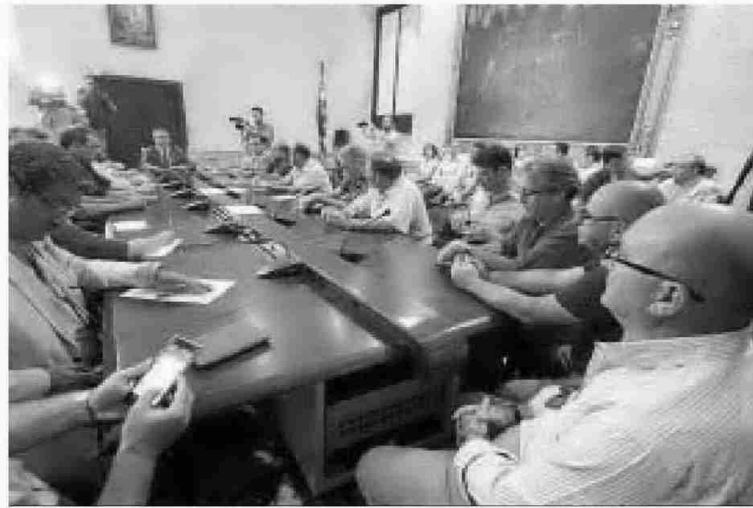
La reunión del alcalde con los representantes sindicales.

Incluye Movilidad y Fiestas Mayores. Entre las unidades asignadas tiene la Policía Local, el servicio y la sección técnica de Fiestas Mayores y la Banda de Música (que en otros mandatos estuvo en Cultura). Habrá dos direcciones generales. Una del Cecop y Protección Civil, y otra de Movilidad. La segunda tendrá signado el Instituto del Taxi, entre otras competencias.