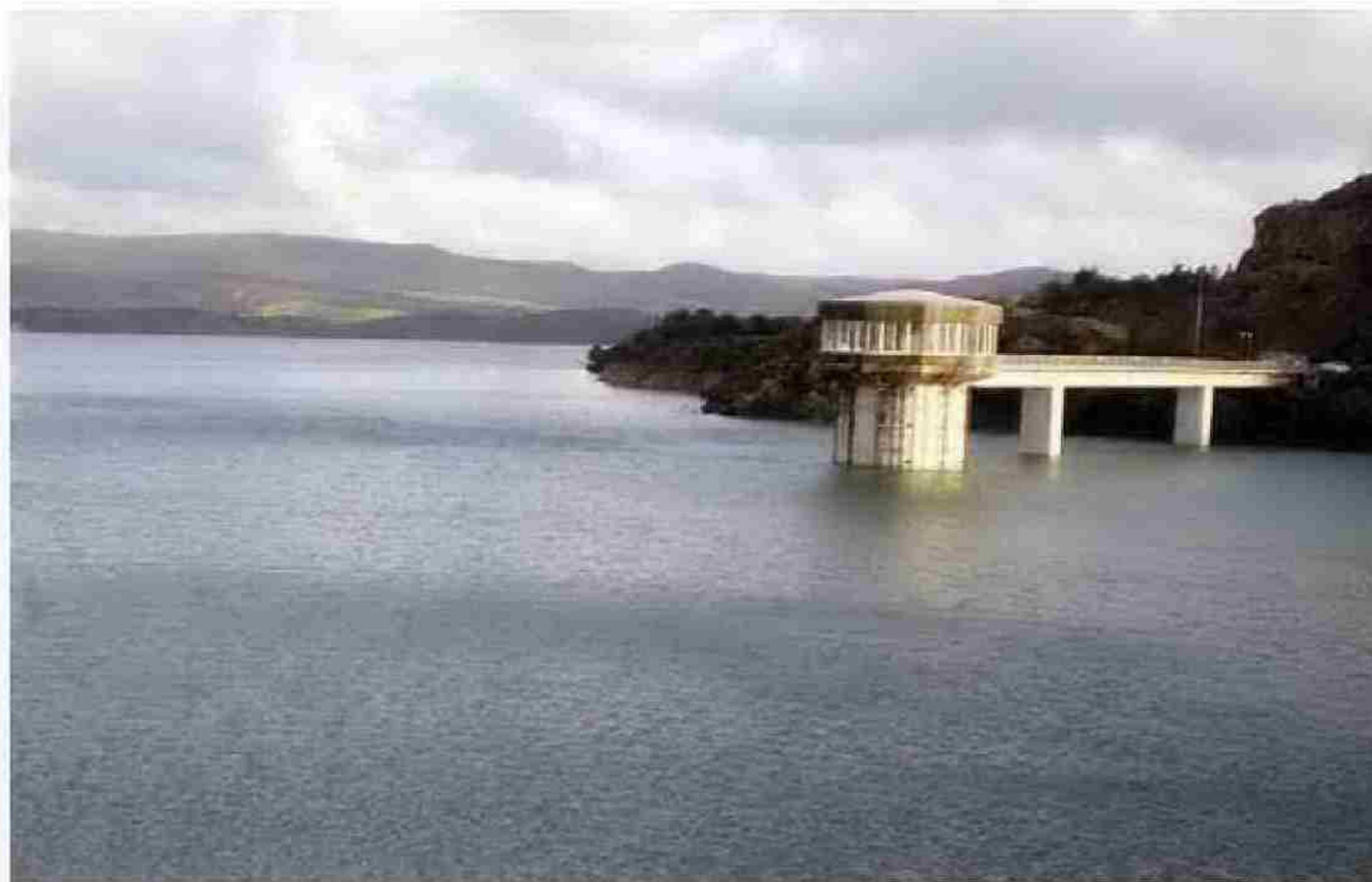
Los niveles actuales de agua embalsada garantizan el abastecimiento y los riegos. VIVA JEREZ

Es decir, la situación actual mejora en casi nueve puntos esa media histórica, con 119 hectómetros cúbicos