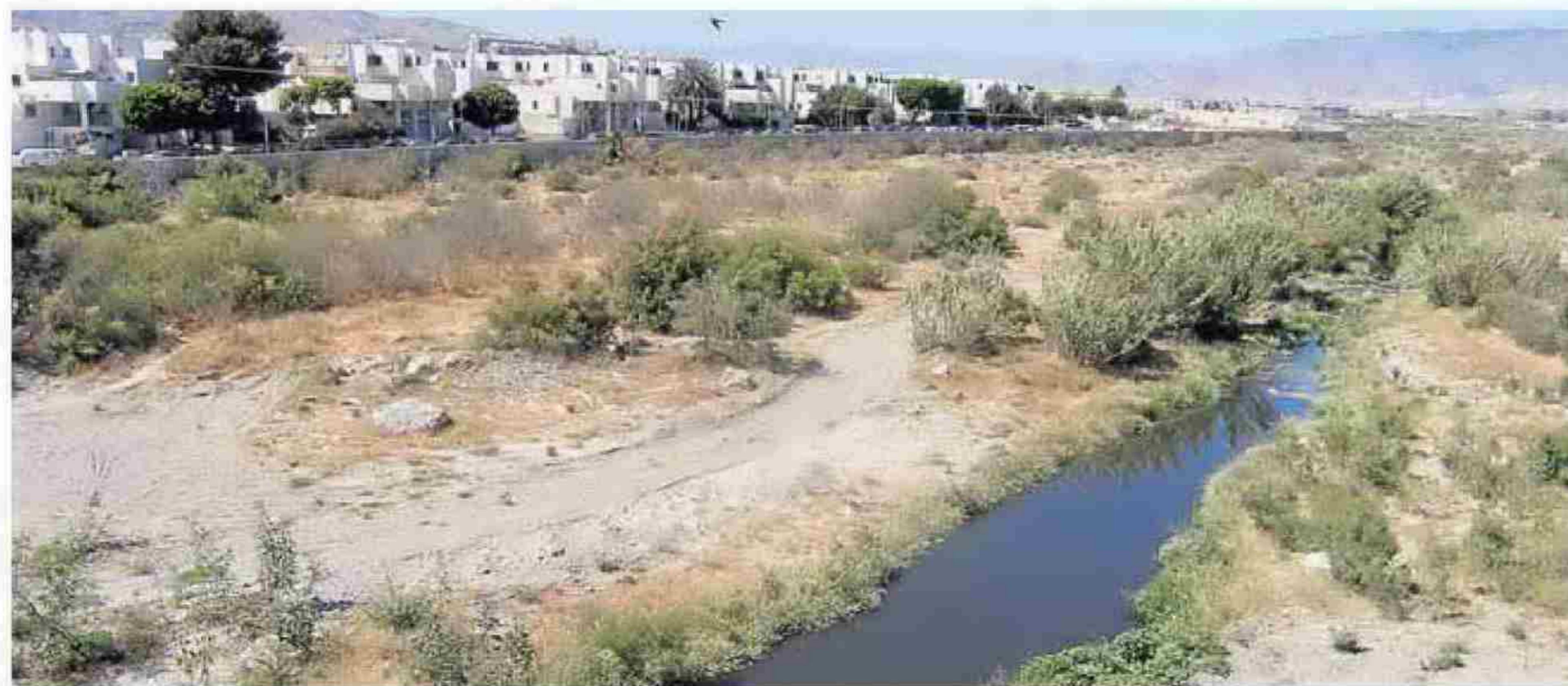
AGUAS RESIDUALES en el cauce del río Andarax en la capital a su paso por la zona de El Puche.

En cuanto al caso de El Toyo, reconoce Guzmán que la depuradora cuenta con capacidad para poder recibir