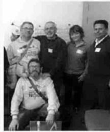
Miembros de la coordinadora.

El colectivo se "congratula" por los resultados que han deparado las elecciones municipales, considerando "la salida" del PP del Ayuntamiento como "el mejor regalo" posible para los jereza-