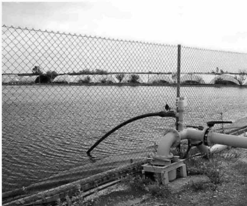
Balsa de riego en el entorno de Doñana.