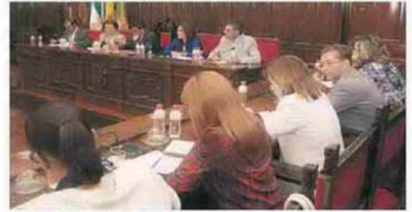
Durante la celebración del pleno en la Diputación. VIVA JAÉN

año, lo que podría permitir el desarrollo de 10.000 hectáreas de olivar con 1.500 metros cúbicos de riego: la única cantidad que garantiza la productividad de estas tierras". Igualmente se pidió que se acometan lo antes posible las conducciones que se requieran.