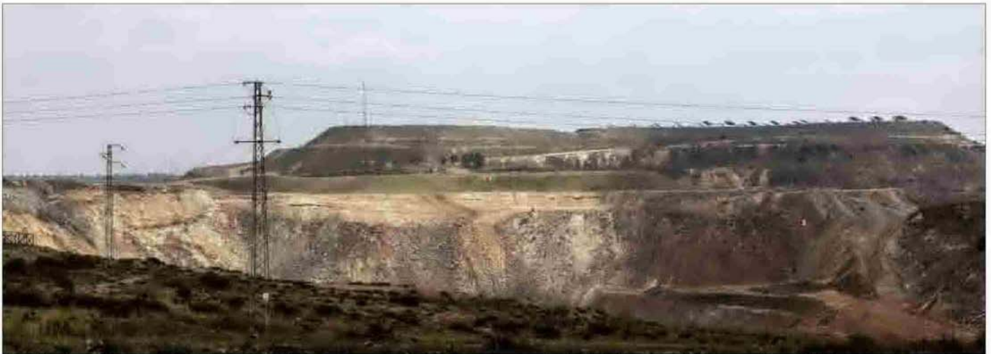
Panorámica de la antigua corta de Los Frailes, en Aznalcóllar, de donde se extraía el mineral y que permanece abandonada desde que ocurrió el desastre ambiental de 1998.