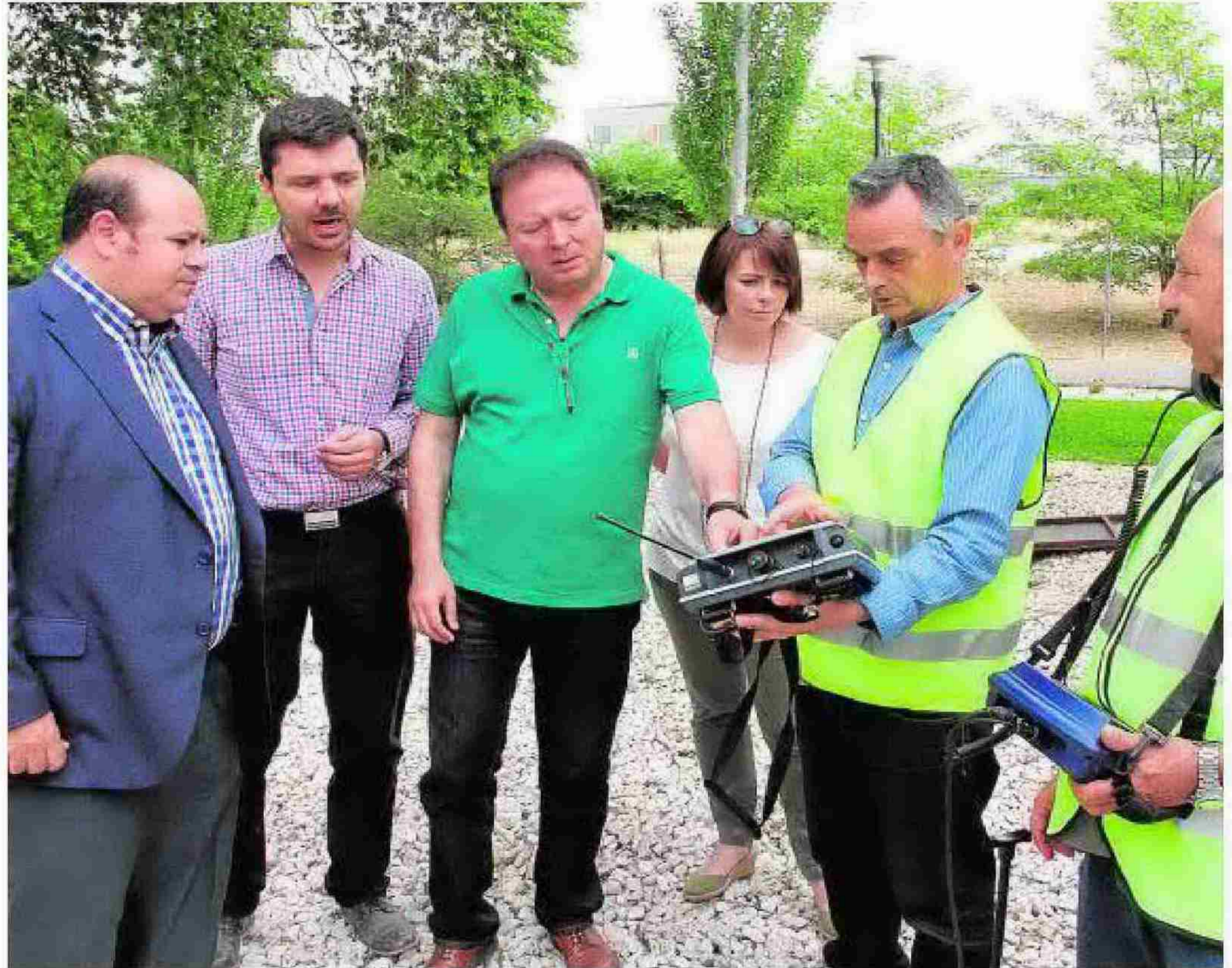
El vicepresidente de la Diputación (i) observa el dispositivo de detección de fugas.

Estos factores, junto con la escasez de medios técnicos y económicos de los municipios, hizo que la Diputación de Granada creara el pasado mes de enero el servicio pro-