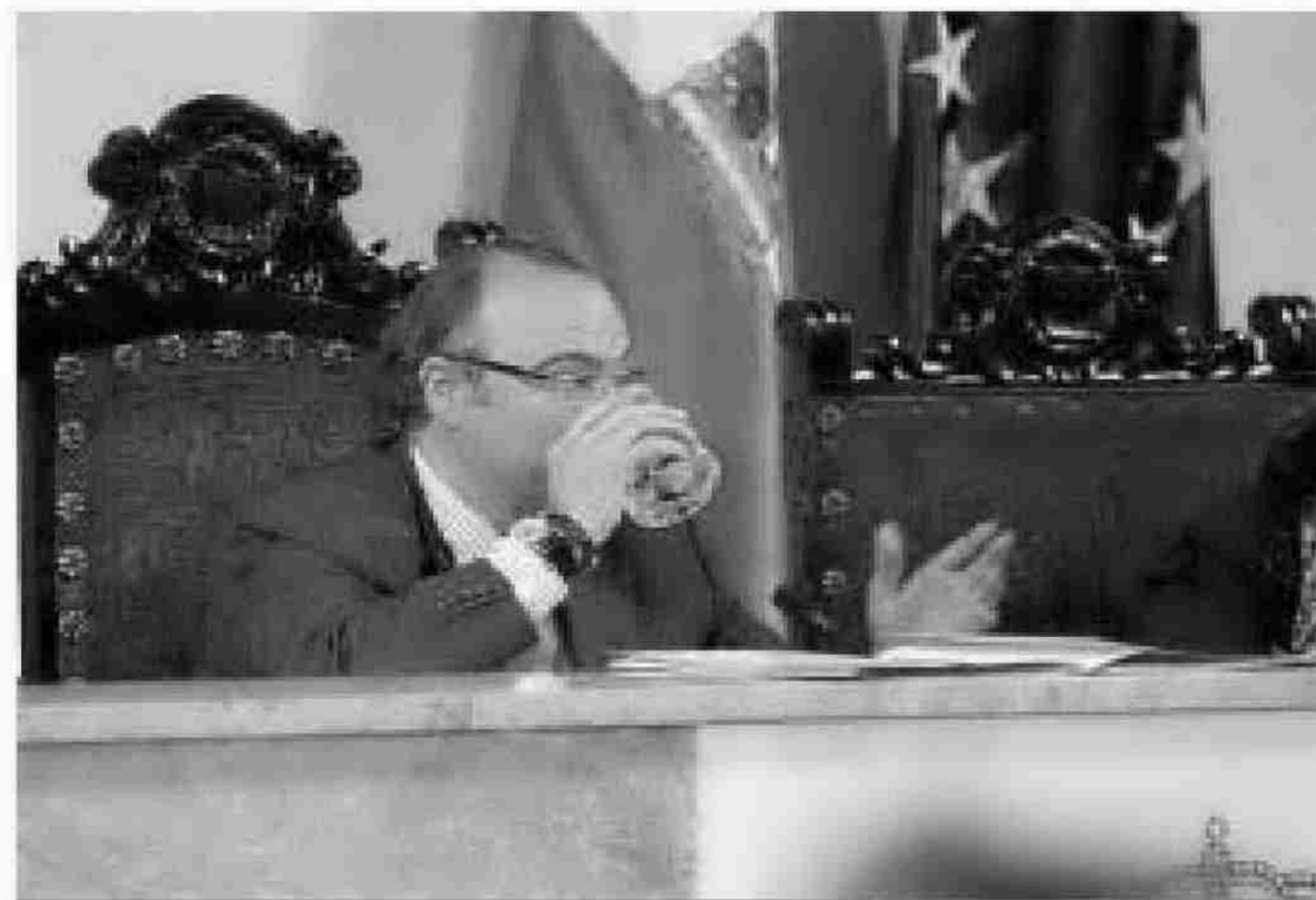
El alcalde bebe agua en una sesión plenaria.

El concepto de familia numerosa se amplía en los recibos. Estando hasta ahora limitadas las bonificaciones para aquellas constituidas por siete o más miembros, a partir de este verano la aplicación de descuentos podrá ser solicitada por las monoparentales y parejas con tres hijos. Las exigencias de cara a los pensionistas con cón-