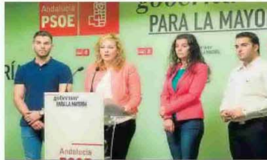
Miembros de la candidatura del PSOE de Adra, ayer, en rueda de prensa.