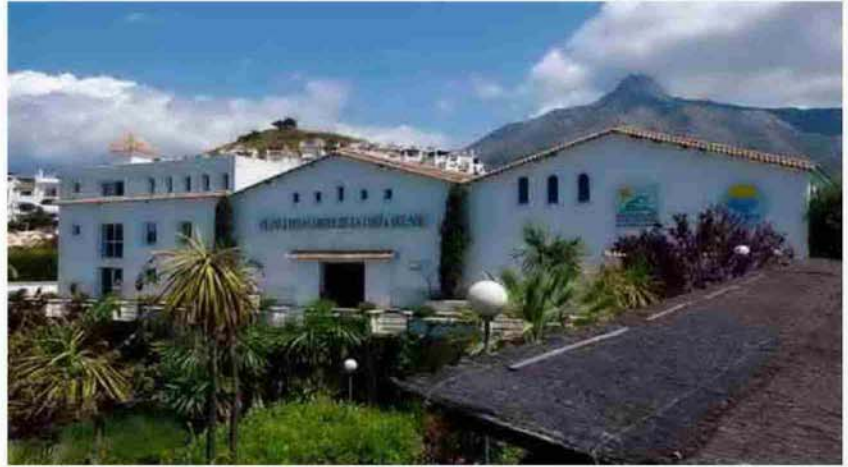
Planta desaladora de la Costa del Sol en Marbella.

Además, este acuerdo posibilitará obras de mejora de la desaladora de Marbella, propiedad de la sociedad estatal. Se busca una mayor eficiencia energética en estas instalaciones, garantizando el cumplimiento de los objetivos marcados en la Directiva Europea y la Planificación Hidrológica, que apuestan por el desarrollo sostenible.