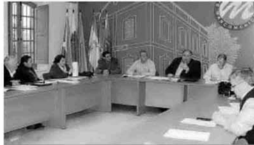
La Junta Rectora de la Mancomunidad ha aprobado ya la medida.