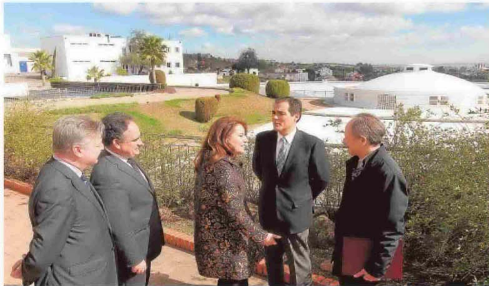
El alcalde y la exdelegada del Gobierno, junto a altos cargos de Emacsa y la CHG