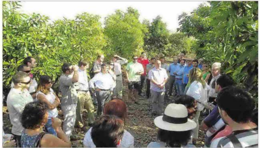
Visita guiada a una finca de aguacates del término municipal de Vélez Málaga.