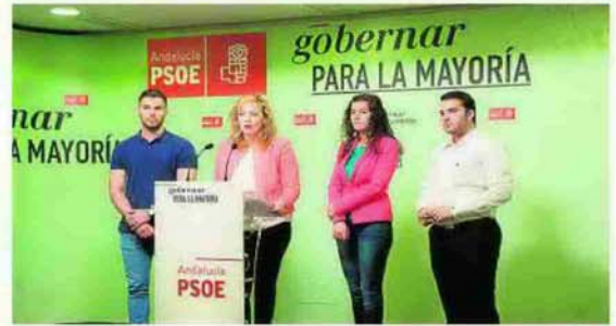
La candidata socialista ayer en la sede provincial del PSOE.