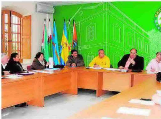
Reunión de la Junta Gestora del Bajo Andarax. :: IDEAL

«Somos conscientes –puntualizó González– de que no se van a resolver todas las necesidades como