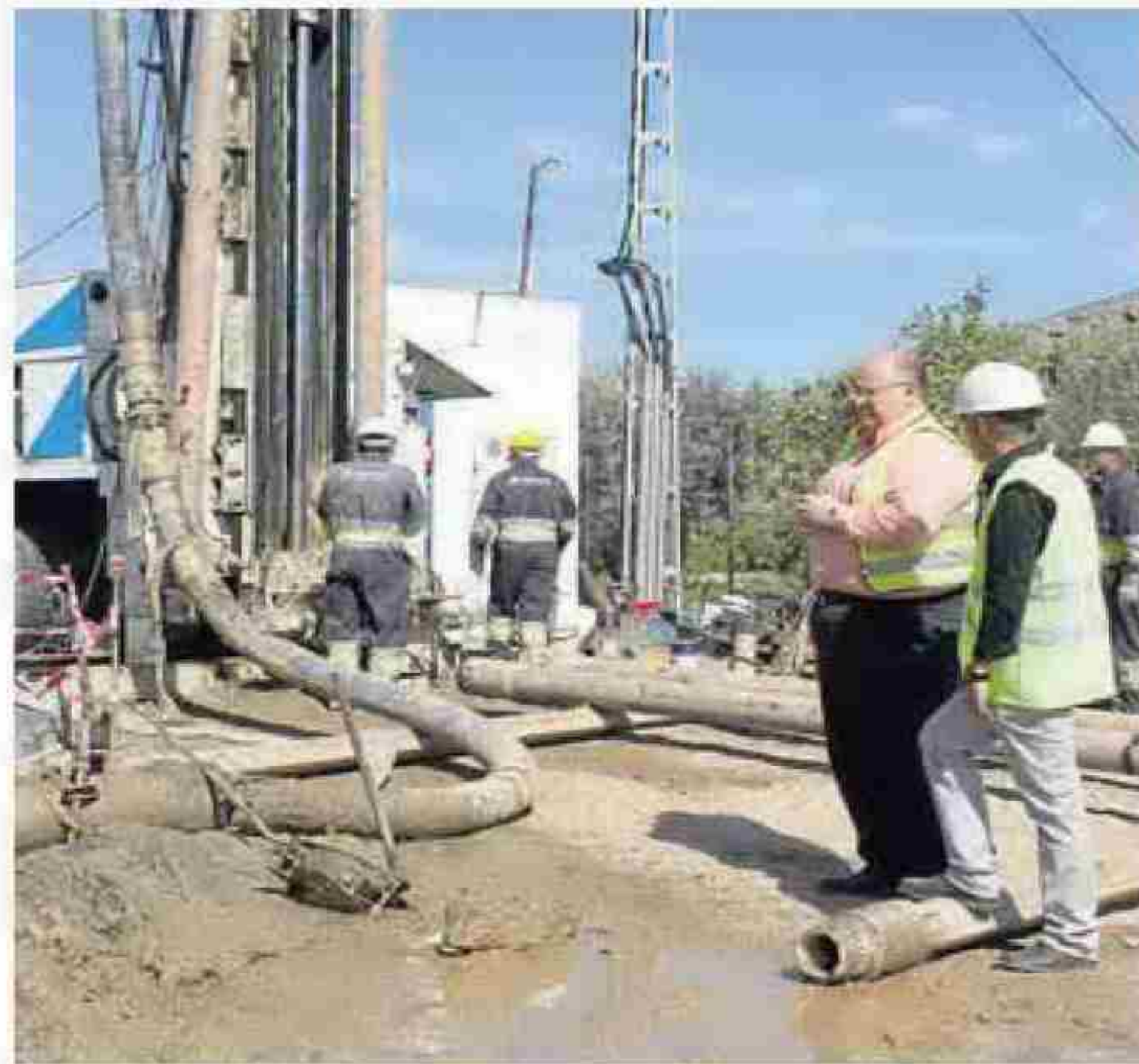
SONDEO que se está realizando en Jacalgarín (Gádor).

La Mancomunidad de Municipios del Bajo Andarax está llevando a cabo la ejecución de un nuevo sondeo en el paraje de Jacalgarín (Gádor), cuyo caudal se destinará a apoyar a los pozos de La Calderona, con el fin de garantizar el suministro a los siete municipios de la comarca. Se trata del nuevo pozo "José Mañas", que está ejecutando la Mancomunidad, a través de Aqualia, empresa concesionaria del servicio de aguas del Bajo Andarax y cuya realización va a suponer una inversión de 120.000 euros. El sondeo está en fase muy avanzada y en estos momentos se está pro-