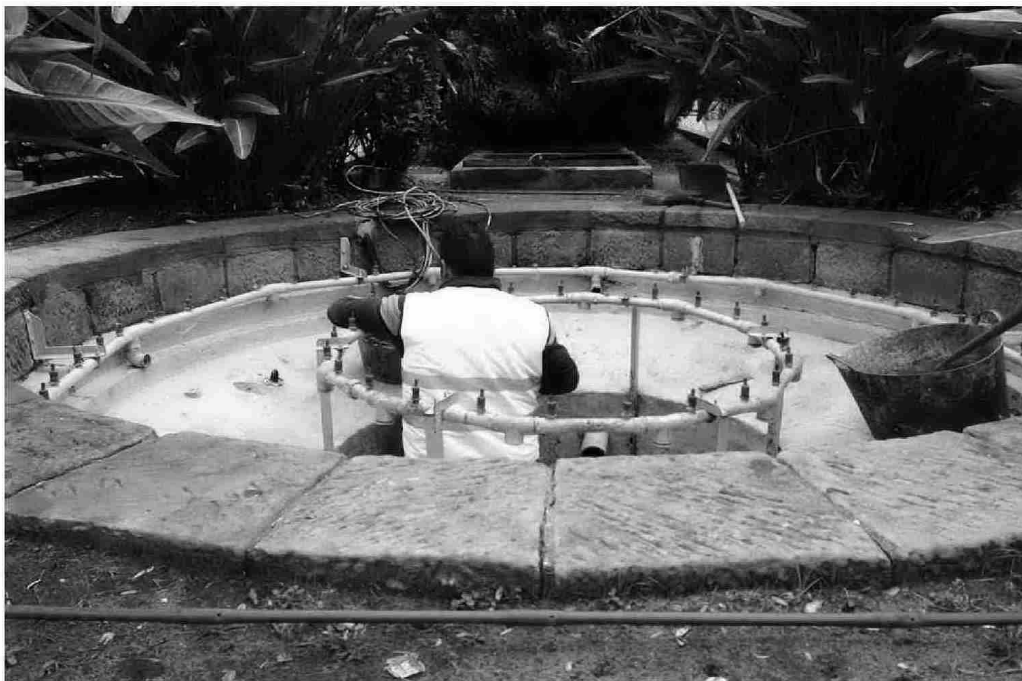
Un operario arregla una de las fuentes del municipio. INFORMACIÓN