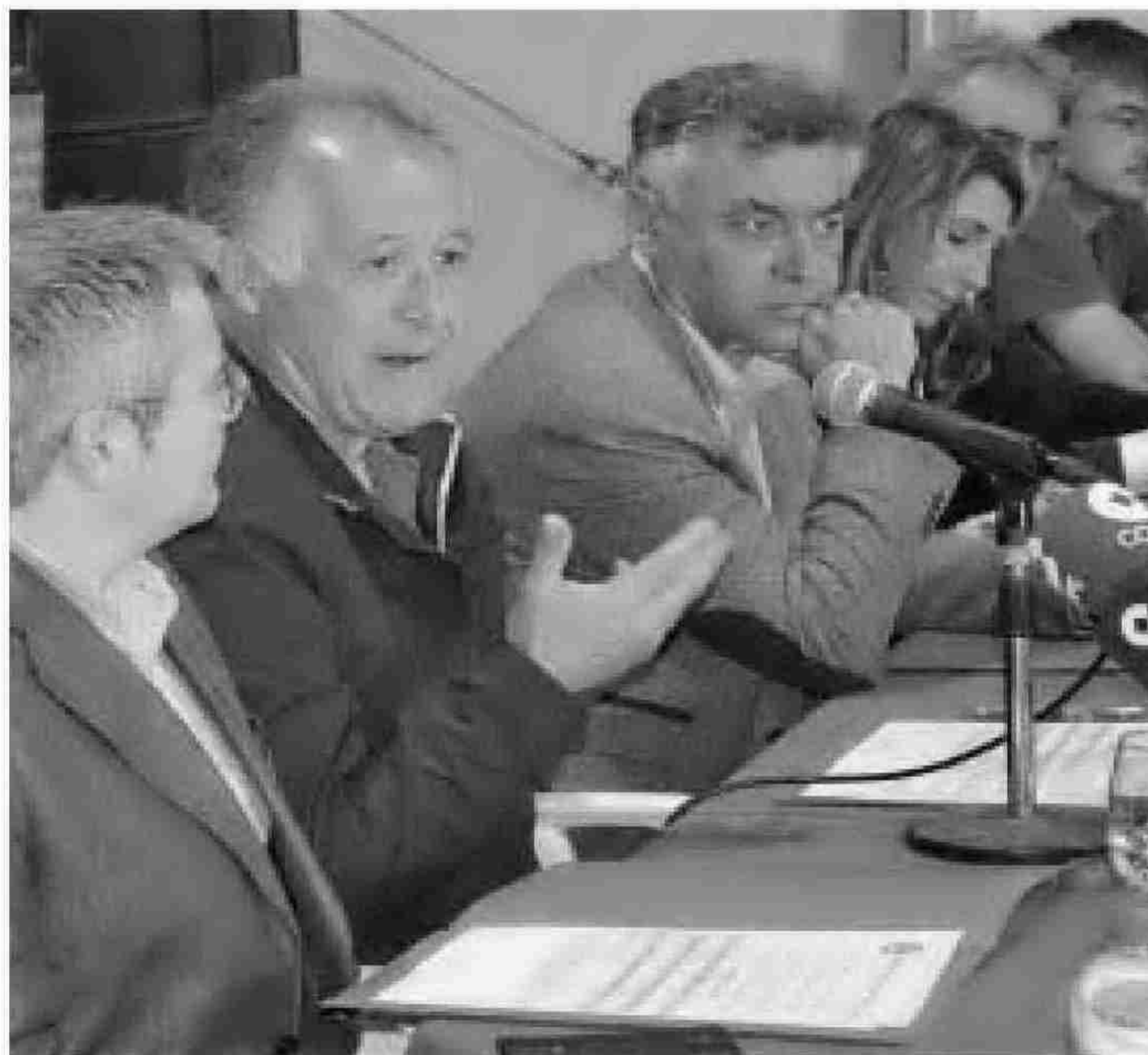
Un momento de la firma del pacto social por los humedales de La Janda.

El delegado ha apoyado el denominado Pacto Social por la Restauración y Protección de los Humedales de la Janda que con el lema "Mójate por la Janda" promueve la Asociación de Amigos de la Laguna para aunar voluntades y esfuerzos de las administraciones y la sociedad para restaurar este espacio emblemático. Los municipios de esta comarca, la Diputación Provincial