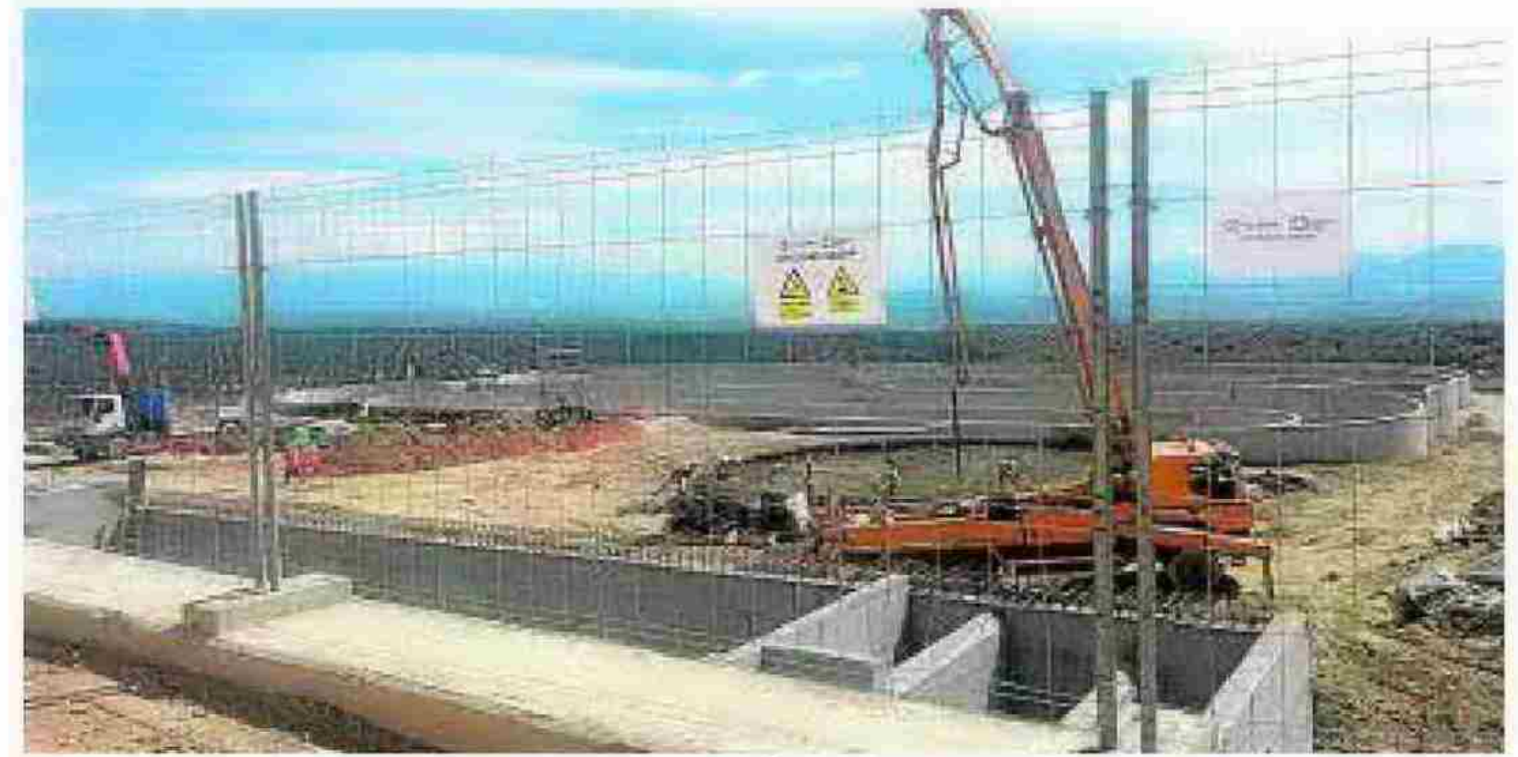
Construcción de la depuradora de Úbeda.