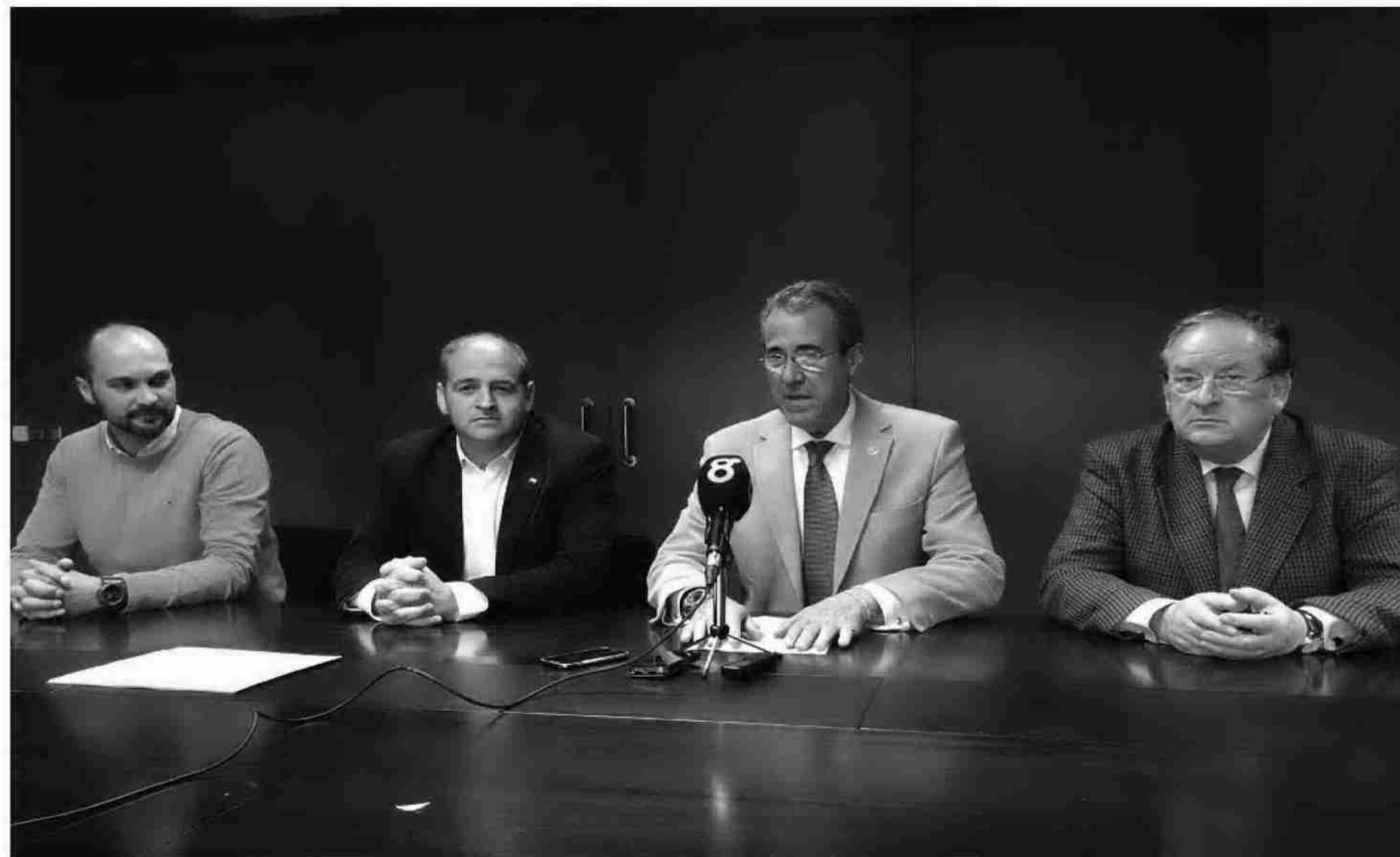
Tras un mes de negociaciones, el juzgado devuelve la situación al punto de partida. INFORMACIÓN