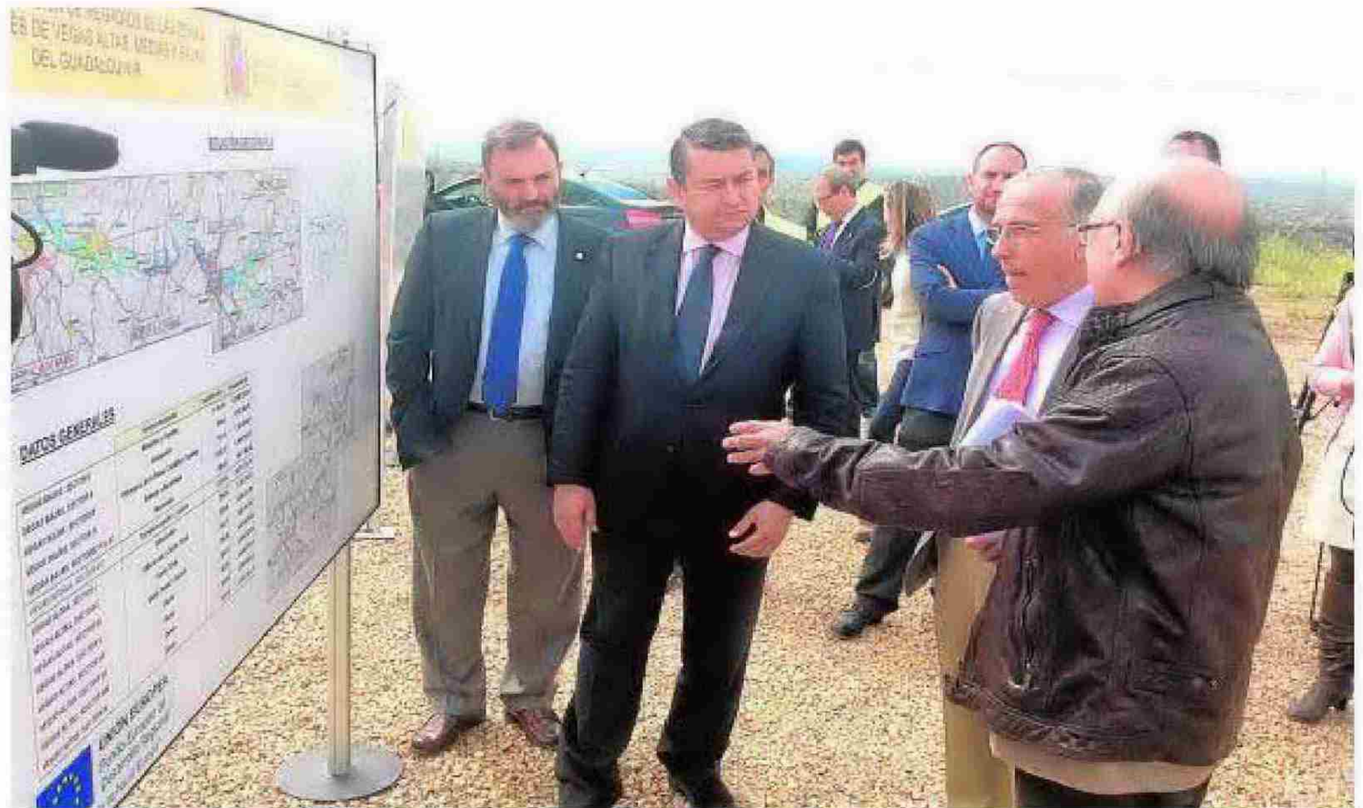
Autoridades realizaron una visita técnica a las vegas bajas.