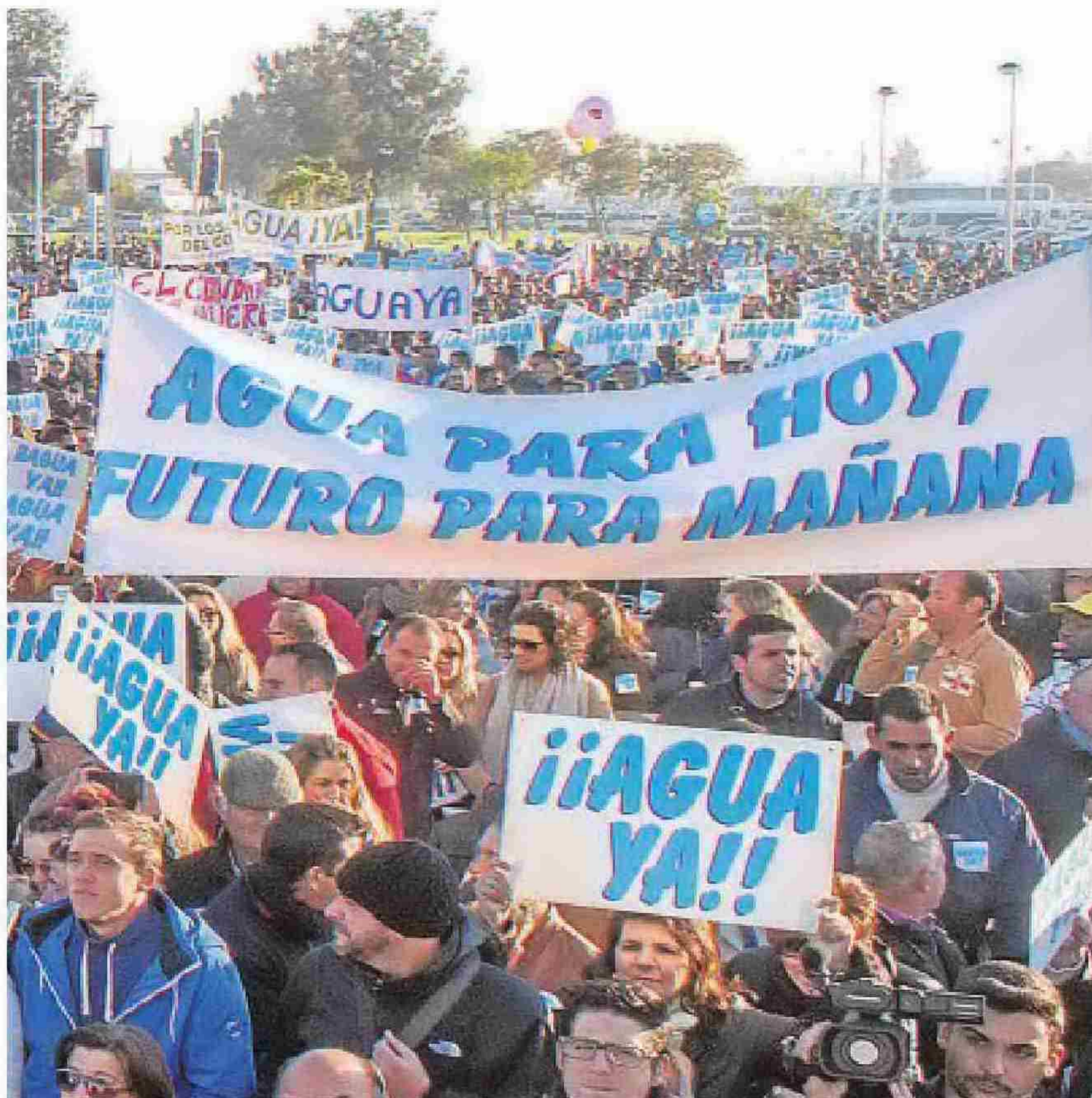
Las restricciones a los regadíos han generado protestas en Huelva

Las reacciones no se han hecho esperar. Ayer tanto los agricultores afectados como el presidente de Asaja-Huelva y el alcalde de Almonte mostraron su satisfacción por esta decisión que garantiza el futuro inmediato de la economía de la zona.