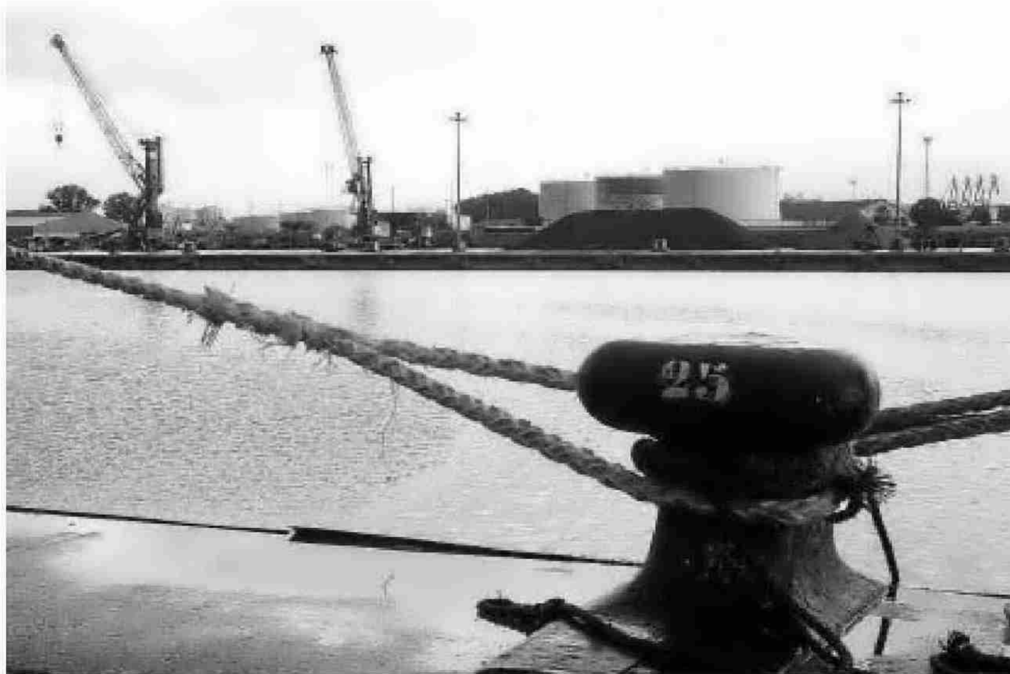
Uno de los muelles del Puerto de Sevilla que recibe los barcos mercantes.

Con ese informe sobre la mesa, los gestores o los políticos deciden; no los científicos. Si una aso-