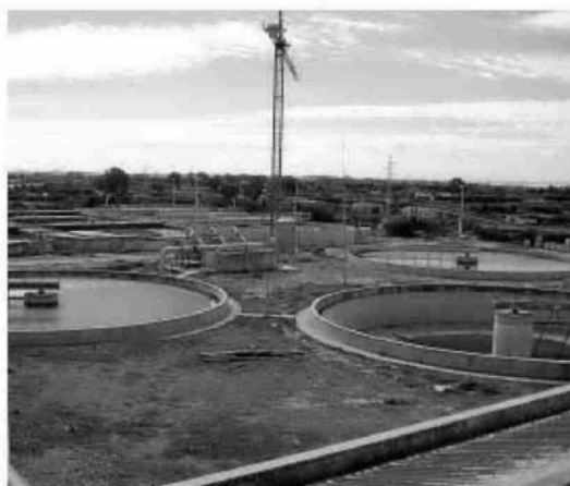
Una vista parcial de las instalaciones de la nueva depuradora.

tre los años 1998 y 2001, recoge las aguas residuales procedentes de la localidad, de la base militar de Rota y de la urbanización de Costa Ballena. Actualmente tiene capacidad para hacer frente a unos 12.000 metros cúbicos de vertido al día y tras la reforma aumentará hasta los 30.000 metros cúbicos, lo que supone que duplicará con creces su capacidad de tratamiento. De esta manera, una EDAR que hasta ahora podía afrontar la depuración de las aguas residuales producidas por unos 70.000 habitantes equivalentes pasará tras las obras a alcanzar la capacidad suficiente para dar servicio a la demanda de 162.500 en la temporada alta y 130.000 en la baja.