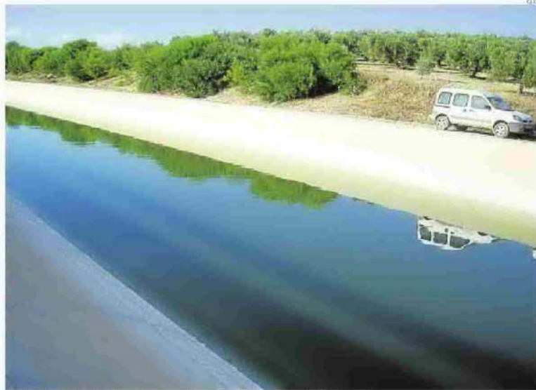
Los trabajos de limpieza se centrarán en el canal principal de la red.

Como consecuencia de ello, ya se han llevado a cabo varias actuaciones de emergencia, aunque el proyecto que ahora se ha adjudicado permitirá una solución de mayor calado a este problema.