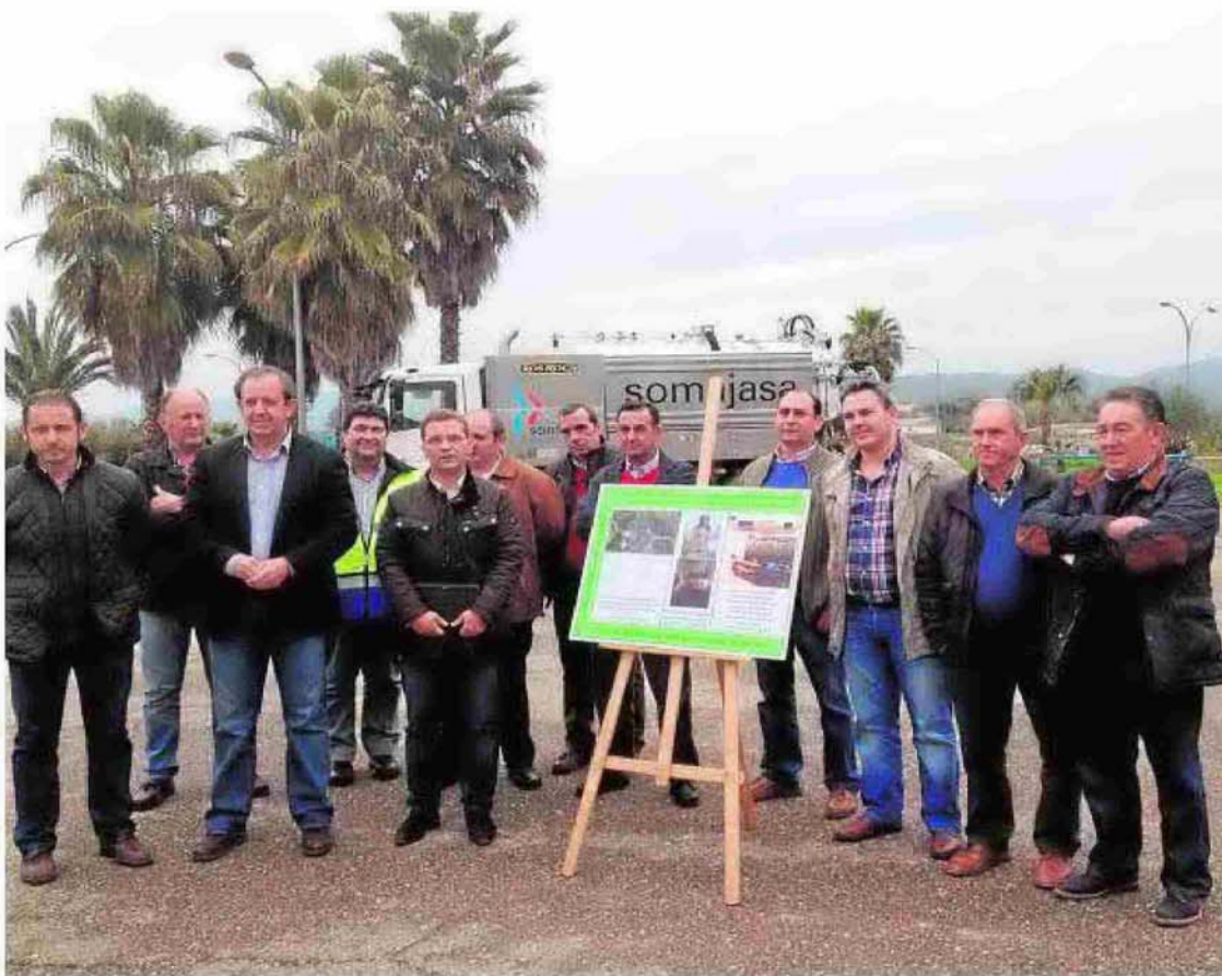
Huertas con miembros de la Corporación y pedáneos.