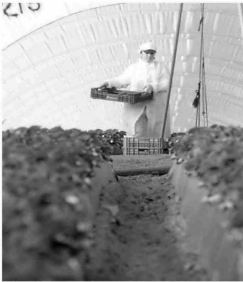
La medida es de vital importancia para los agricultores de fresas y otros berries de la zona del Condado.