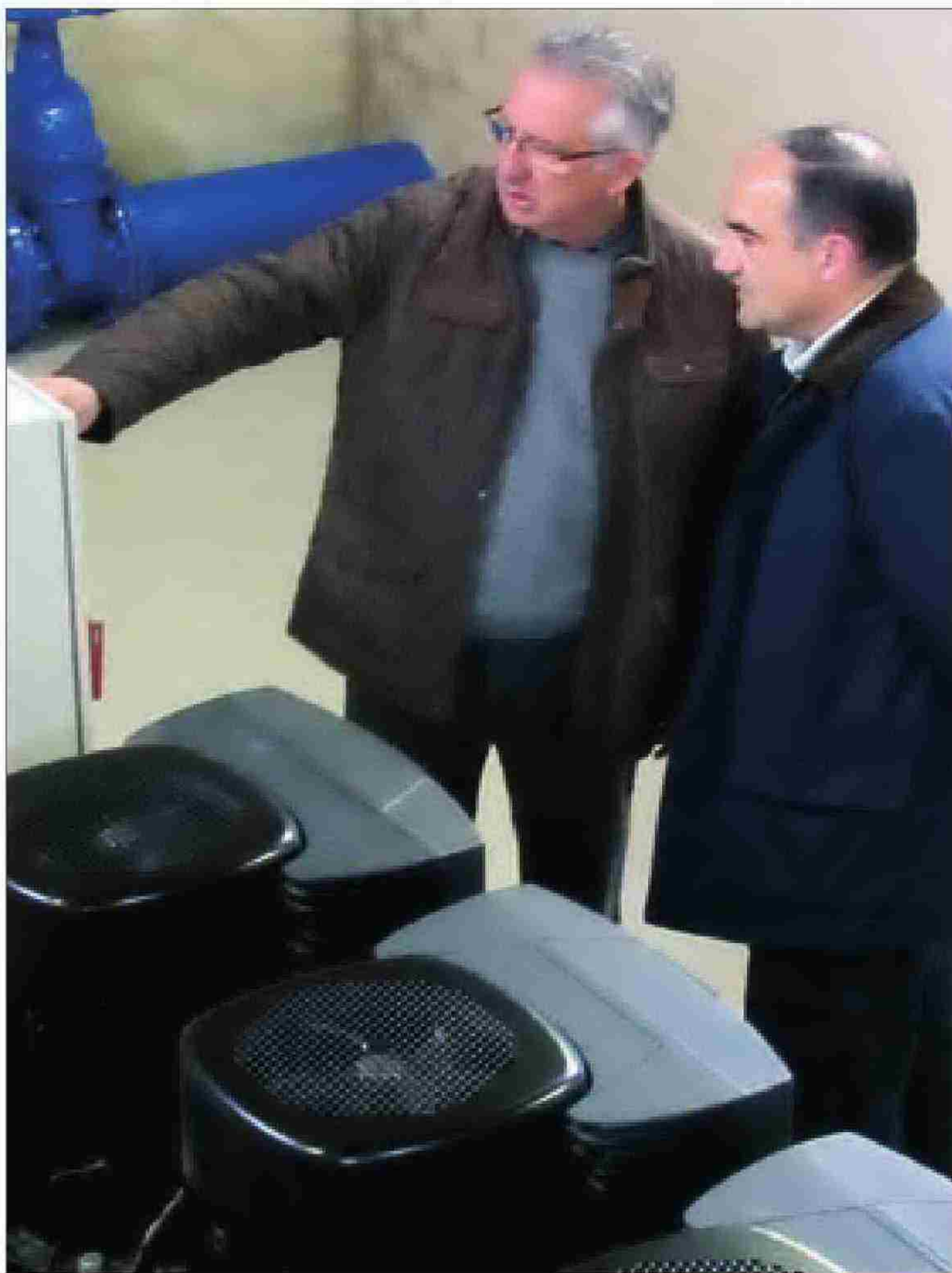
El alcalde, junto al representante de la empresa concesionaria.

TRES PROBLEMAS. Manifestó que el grupo sobrepesador instalado resuelve los problemas de caudal al pasar de 400 metros cúbicos hora a 600 metros cúbicos hora. Y, por último, el gran problema de la presión del agua que al pasar a trabajar con 1 kilogramo ahora muchas viviendas de la zona alta de la ciudad están dejando de tener