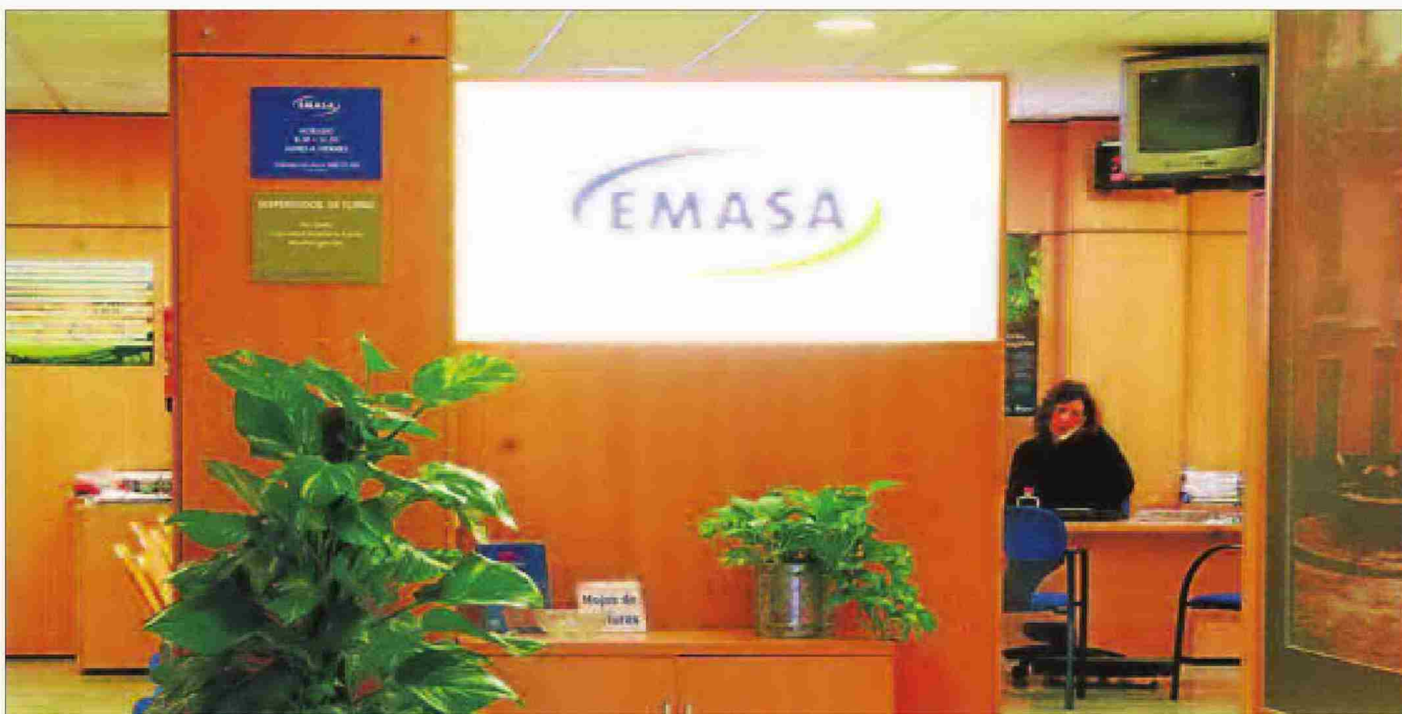
Oficinas centrales de Emasa en su sede del Hospital Noble.