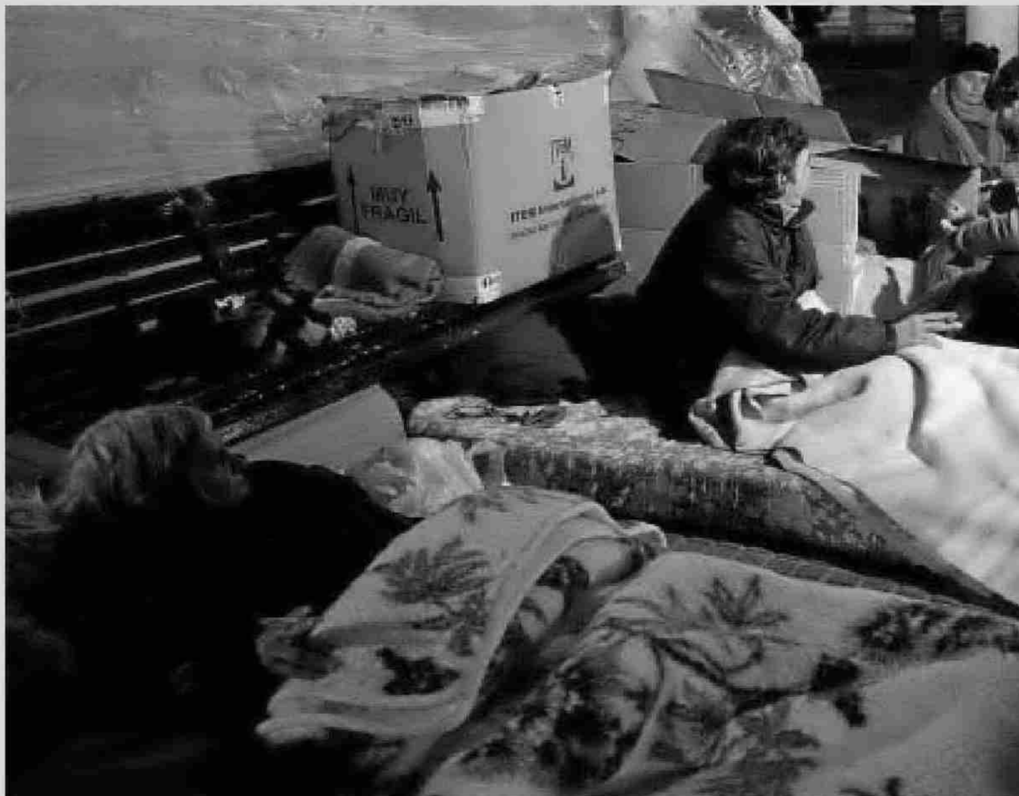
Personas durmiendo en la calle hace unas semanas.

Aunque la mayor parte de las personas atendidas desde Cáritas son desempleados de larga duración, cada vez más piden ayuda quienes tienen trabajo pero el salario que perciben no es suficiente para satisfacer las condiciones de vida mínimas. Tienen empleos irregulares, con jornadas parciales y una alta temporalidad.