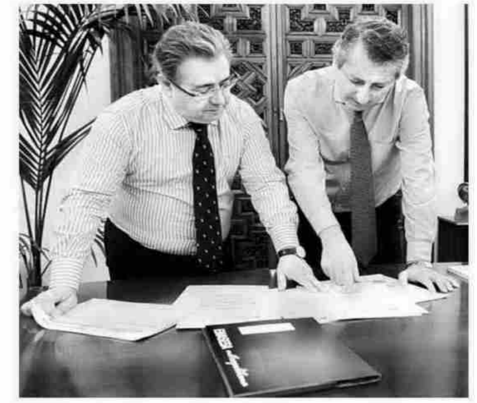
Zoido con el consejero de Emasesa.

drá un «ahorro en intereses de siete millones de euros», una operación que «aún no está cerrada», «por lo que es una irresponsabilidad lo que ha hecho el PSOE, hablar sin saber». «Pagando lo mismo que pagamos ahora, con esta operación nos va a permitir realizar más obras e inversiones». ■