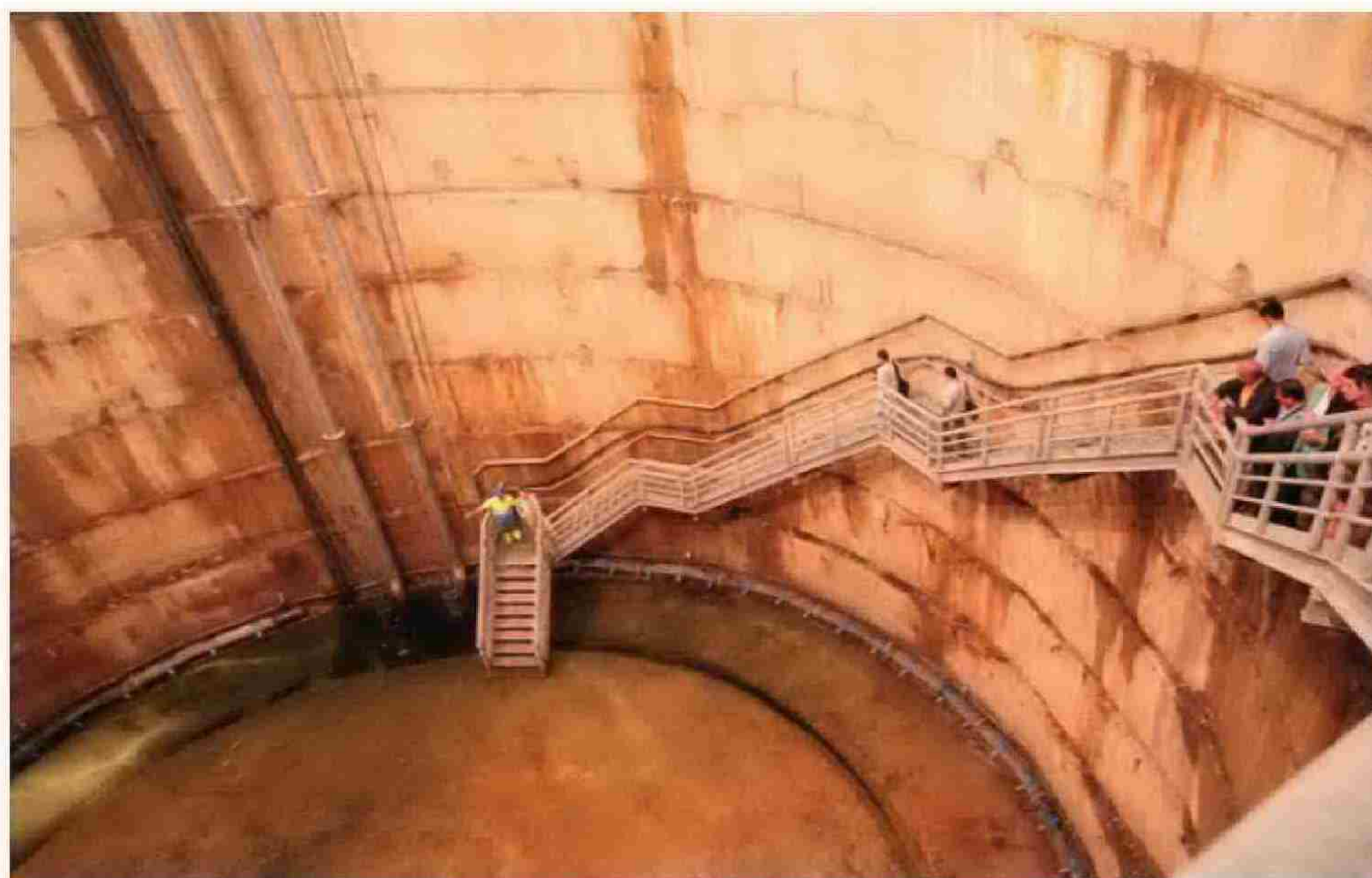
PSOE cuestiona que prioricen tanques de tormentas frente a depuradoras como la de San Jerónimo.