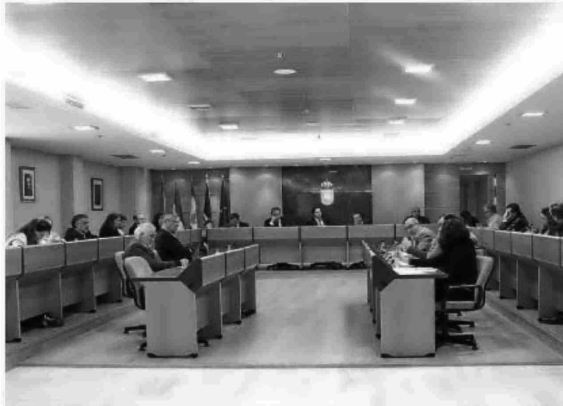
Imagen del pleno municipal de esta semana.

También se ha añadido un apartado a la ordenanza del Impuesto sobre Vehículos, aclarando cómo tributan las motocicletas con motor eléctrico y cómo se