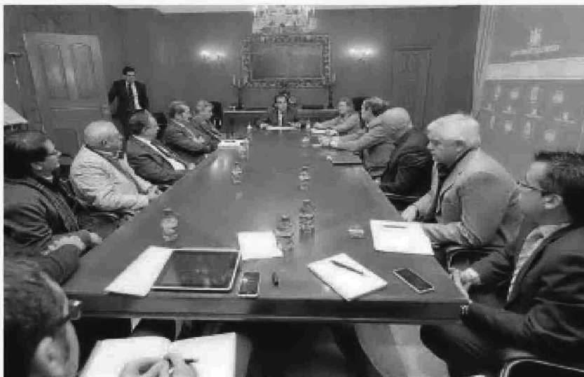
Reunión de la comisión municipal de polígonos, celebrada ayer