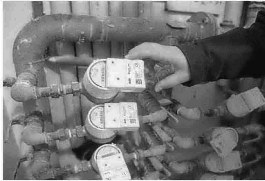
En la nueva tarifa se tiene en cuenta el consumo por habitante.

MÁLAGA. El paso del tiempo, y sobre todo las continuas e improvisadas rectificaciones del Ayuntamiento para evitar que el recibo se disparara parecen haber conseguido que el sistema de facturación que Emasa aplica desde noviembre de 2013 no haya resultado tan fiero como se pintaba en un principio para una familia tipo, aunque sí que ha afectado a quienes viven solos o en pareja. Así lo constata el estudio comparativo a nivel nacional que cada año elabora la organización de consumidores Facua, precisamente uno de los colectivos que se opusieron al nuevo sistema al demandar que se ampliara el umbral de gasto a partir del cual se dispara la factura. Según este informe, Málaga es la capital andaluza con el agua