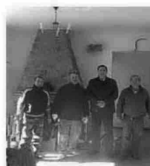
EL ALCALDE en una de las casas rurales.

El cambio de carpintería es otra de las actuaciones que se están llevando a cabo. Actualmente, las puertas y ventanas han sido destruidas por la carcoma por lo que se se cambiarán para protegerlas y mejorar la eficiencia energética de las casas. Por último, se limpiarán todas las viviendas, serán pintadas y se repararán