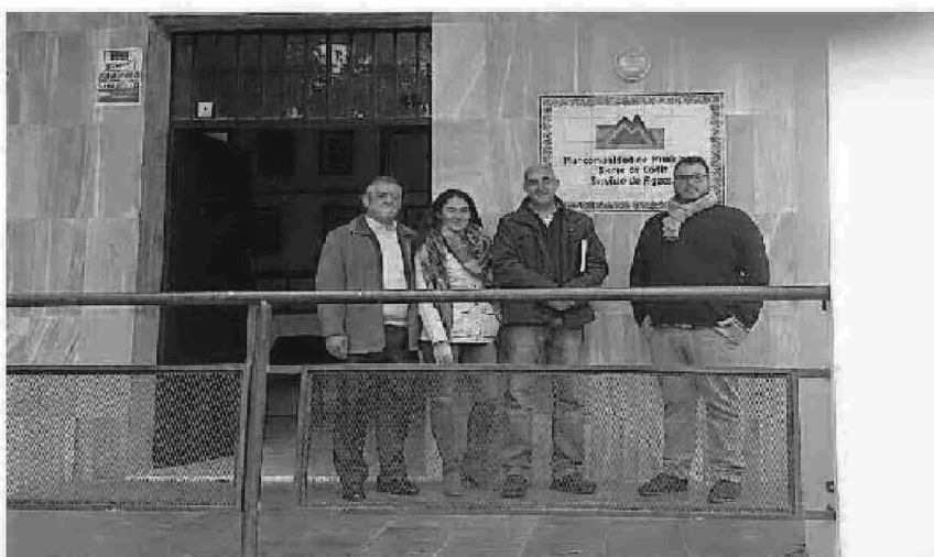
Los responsables del PA entregando el escrito en Aguas Sierra de Cádiz.

En concreto, los andalucistas destacan que en los recibos que la empresa pública cobra a los setenileños se incluye una cantidad por depuración y otra correspondiente al canon autonómico por este concepto, cuando «la depuradora de Setenil lleva mucho tiempo sin funcionar». Destacan que la misma no realiza la función para la que fue creada, sanear las aguas fecales, por lo que sus gastos son nulos