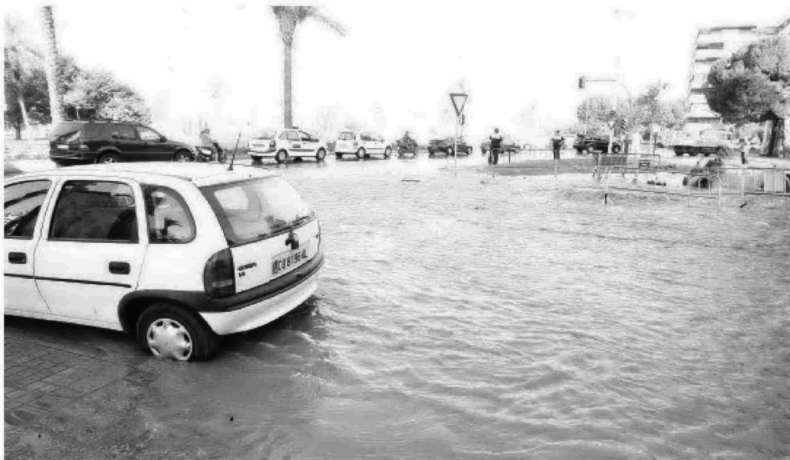
Inundación por rotura de una tubería de agua en Cañero