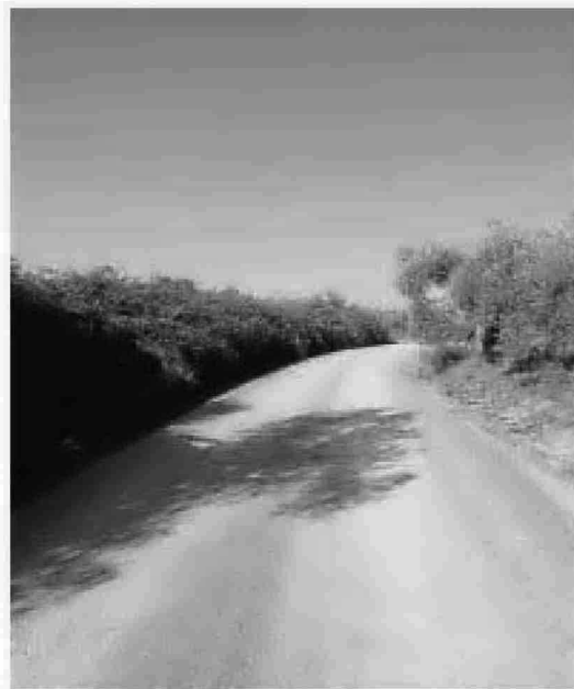
El Camino de Las Lapas beneficia a los agricultores.