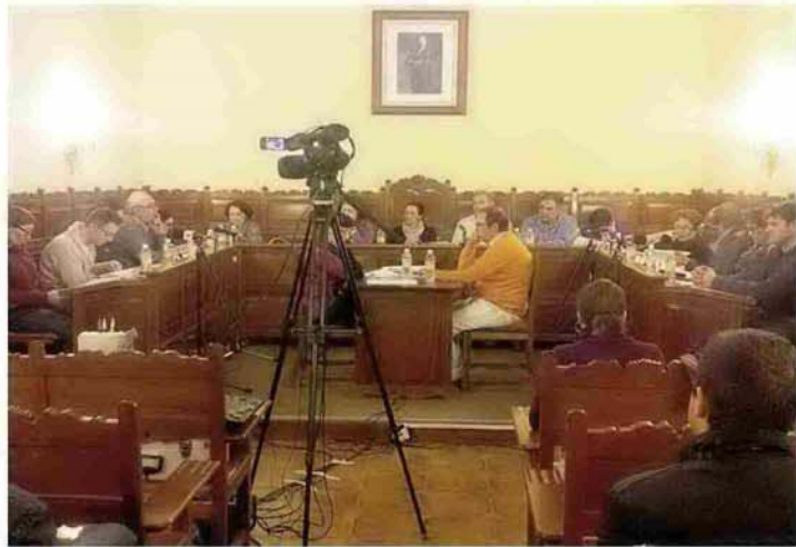
El pleno se celebró el pasado martes por la noche.