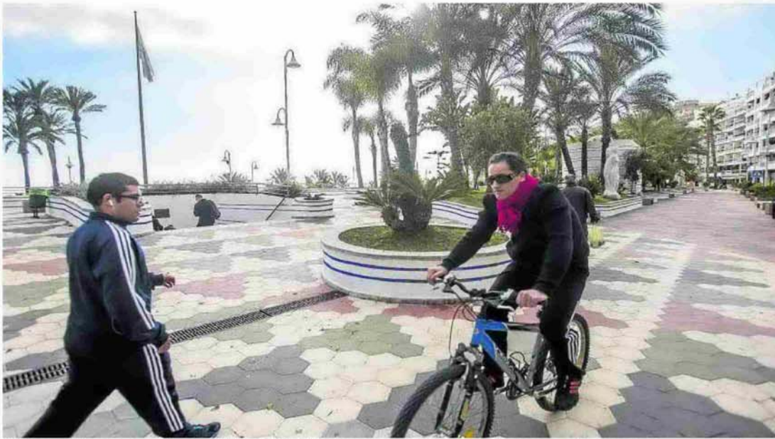
Ciclista y peatón se cruzan en la acera del Paseo del Altillio a la que le ganará terreno la calzada para ampliar su anchura.