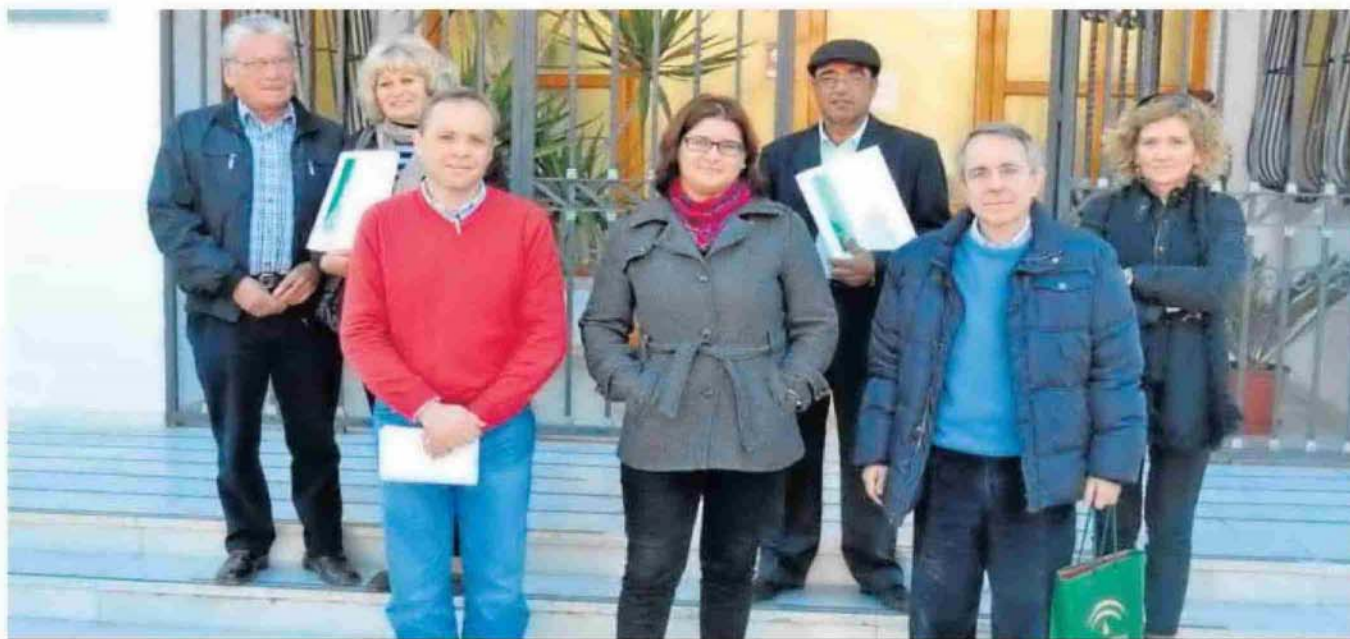
La concejal de Urbanismo junto a los técnicos de la Junta de Andalucía y los propietarios de las viviendas que serán rehabilitadas con la subvención del gobierno regional.