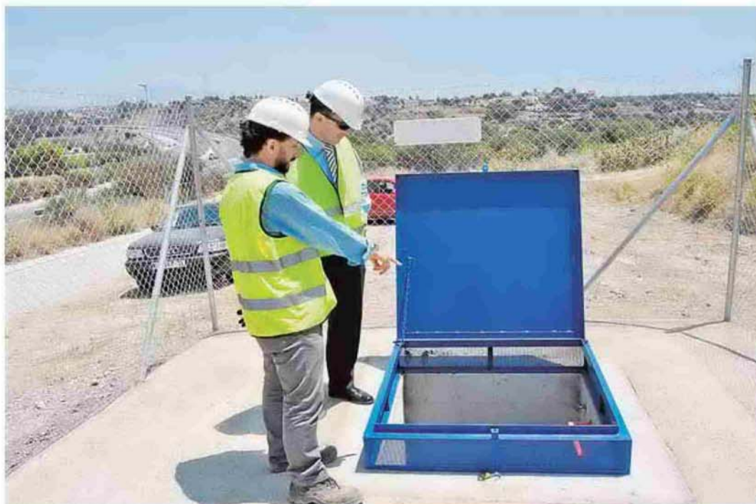
Operarios en la instalación de una nueva tubería.

Desde el 2012, el primer tramo de facturación del agua –unos siete metros cúbicos al mes–, están bonificados para aquellos mayores de 65 años que no superen el salario mínimo interprofesional. Esta medida se incluyó en las ordenanzas fiscales, junto a la reducción en una veintena de impuestos y tasas municipales.