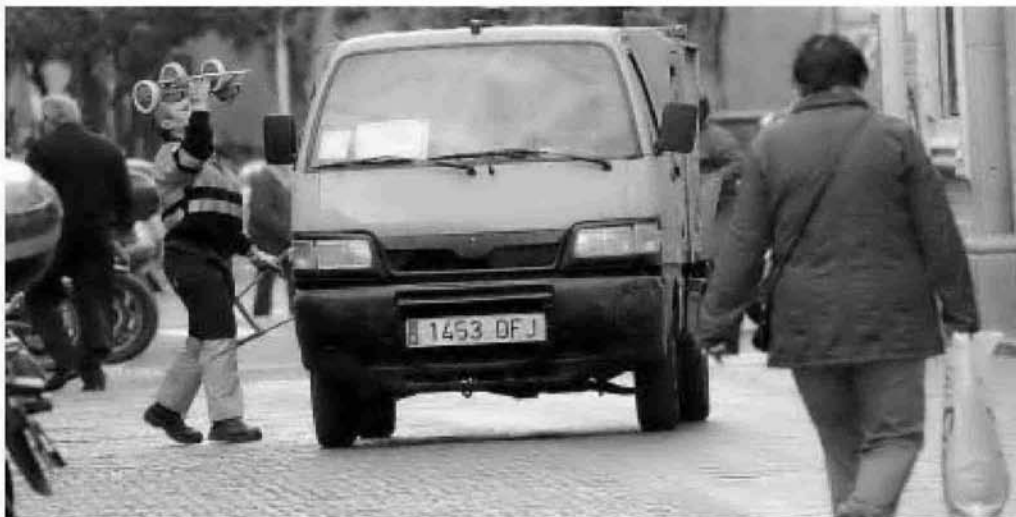
Un vehículo de Lipasam de faena por las calles del centro de la ciudad.

Los resultados de ahorro, según Maza, quedan reflejados en las