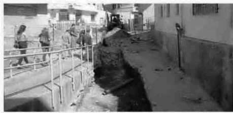
OBRAS en Rambla de las Cruces para evitar inundaciones.