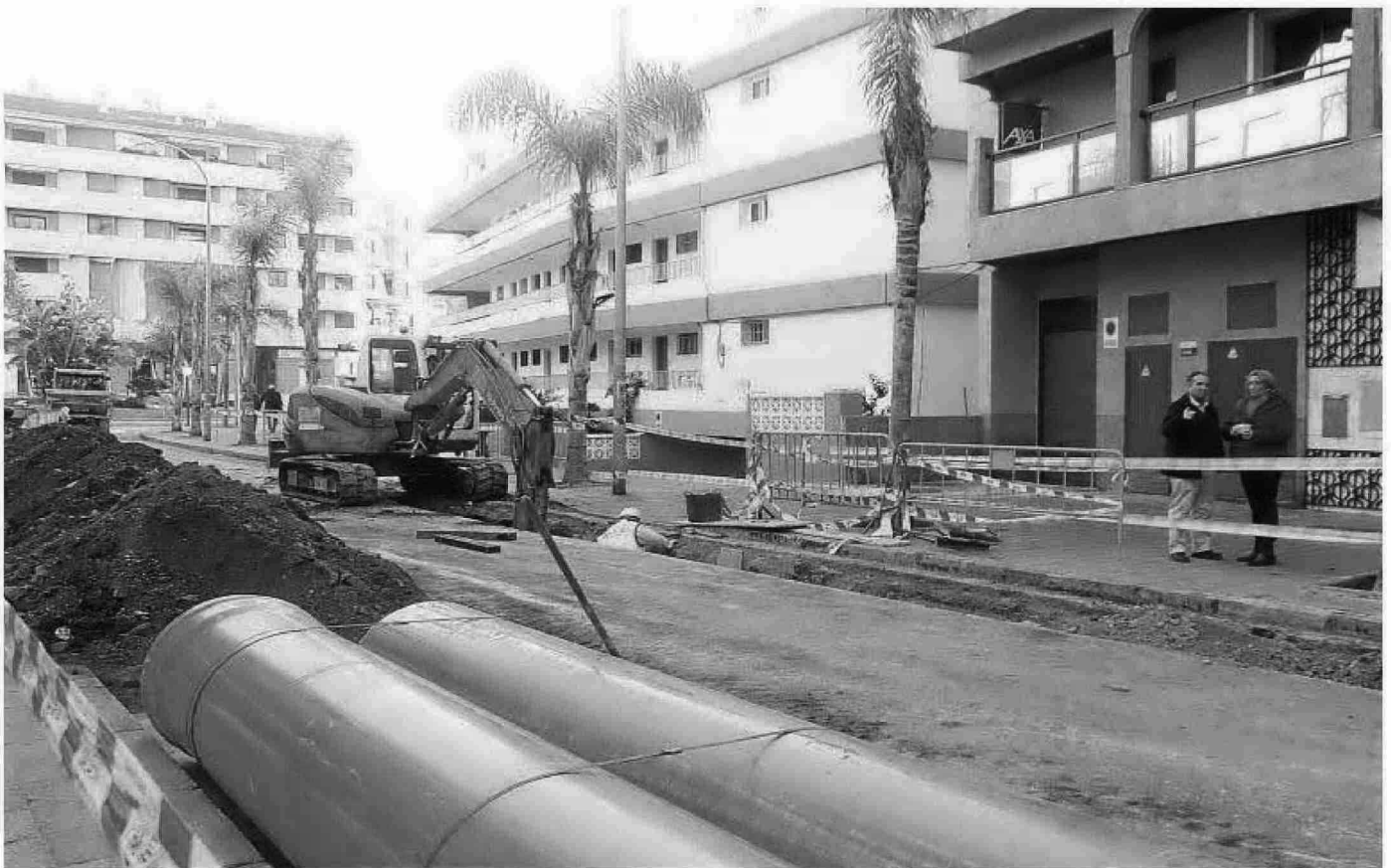
La alcaldesa de Almuñécar visitó ayer las obras del entorno de plaza Madrid que ahora se centran en la calle Hurtado de Mendoza.