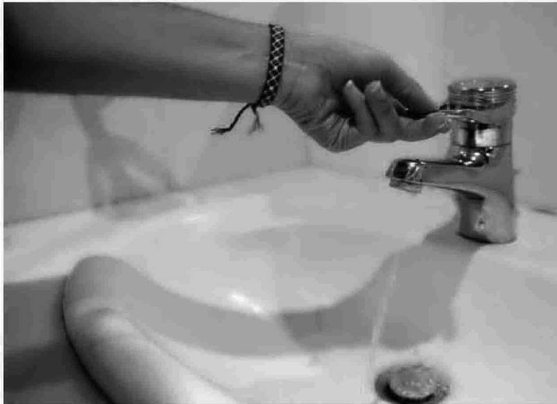
El equipo de gobierno abderitano reconoce bajadas de presión en el suministro de forma muy puntual.

Además, se han mejorado todos los sistemas y equipos de los pozos que dan suministro al municipio, se han renovado y se siguen renovando las redes de abastecimiento y saneamiento en numerosas calles de la ciudad, ya que en muchas de ellas, el diámetro de las tuberías se había quedado pequeño con el crecimiento del municipio, "problema que no