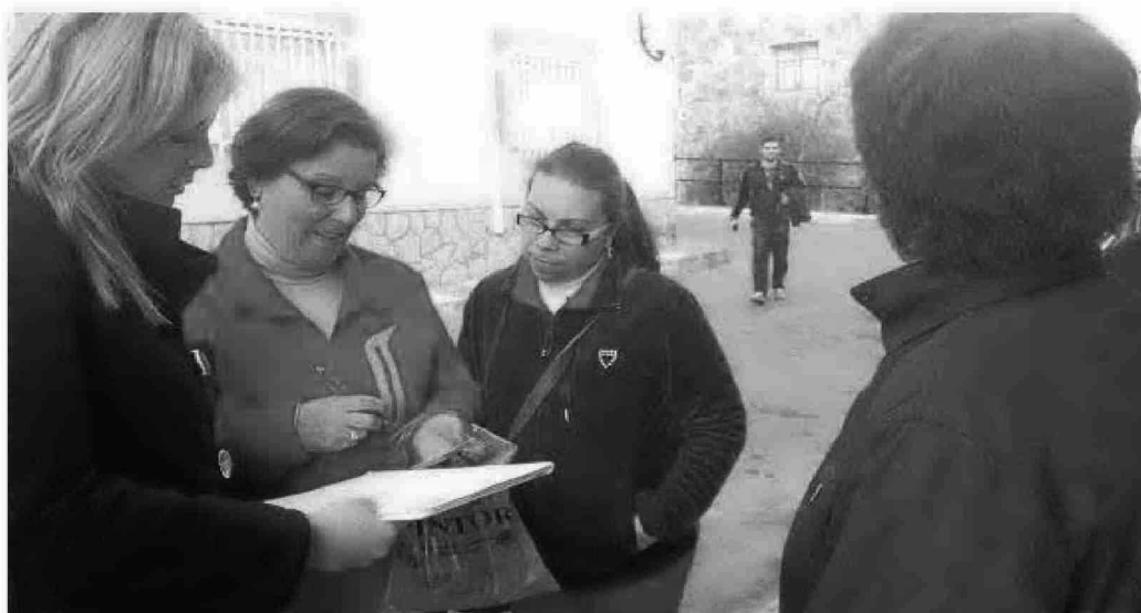
La secretaria del PSOE de Adra participa en la recogida de firmas para protestar por la situación. :: IDEAL