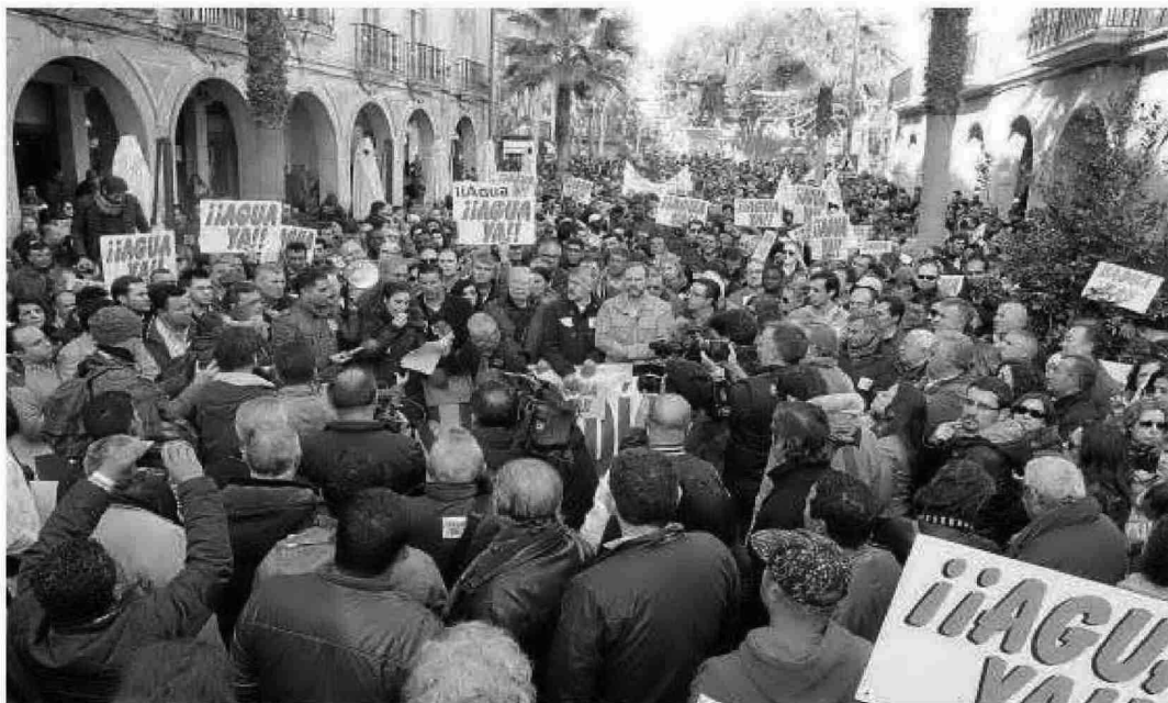
Final de la manifestación, ante la Subdelegación del Gobierno, donde el subdelegado recibió a la plataforma.

Primer trasvase La Subdelegación recuerda que la transferencia de 4,9 hectómetros cúbicos ya está en marcha, con un presupuesto de 20,5 millones