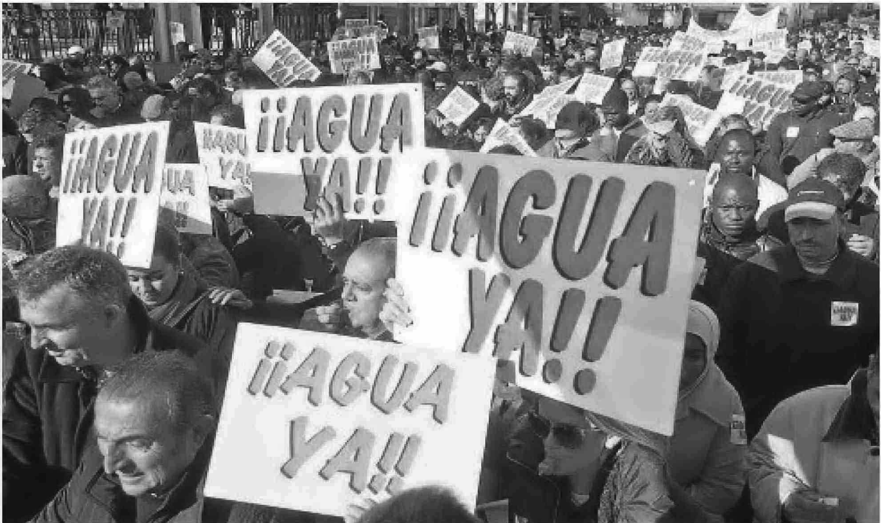
Aspecto de la manifestación de ayer que el sector considera histórica por la gente que acudió