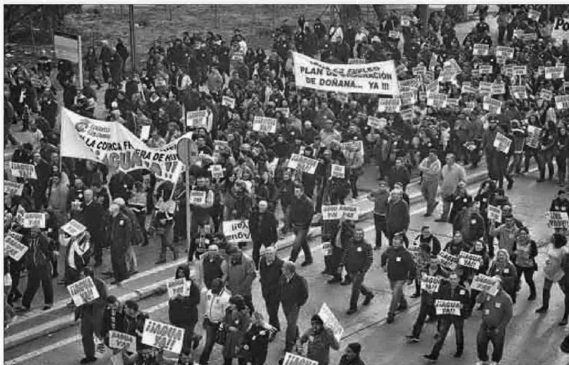
Aspecto de la manifestación de los agricultores del Condado ayer por las calles de Huelva.

Actividad agrícola que se viene desarrollando desde hace más de 30 años y que es el motor indiscuti-