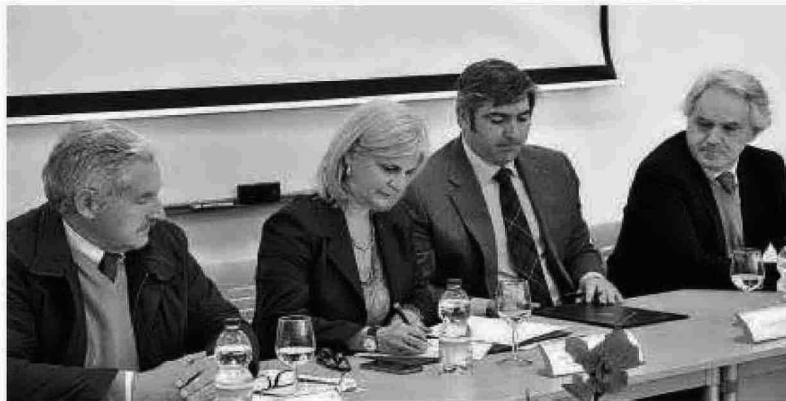
La alcaldesa y el presidente de los empresarios del PTA firman ayer el acta en presencia de otros delegados municipales.

El Ayuntamiento mantiene su apoyo al parque a través de sus servicios municipales