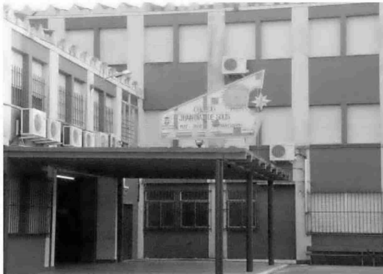
Acceso principal al colegio de Infantil y Primaria Juan Díaz de Solís, uno de los centros afectados.

Educación asegura que es competencia del Consistorio, al igual que el resto de colegios públicos.