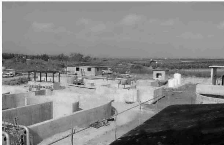
Instalaciones de la EDAR de Bollullos antes de su inauguración, en marzo del año pasado.