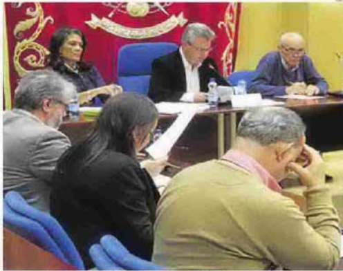
► Pleno celebrado anoche en el Ayuntamiento de Puente Genil.

En el cuerpo de la moción se recordaba que las obras del Plan del Río a su paso por Puente Ge-