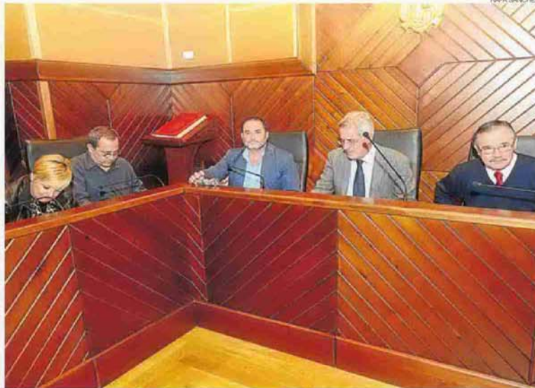
►► Un momento de la sesión plenaria de anoche en Pozoblanco.

Por otro lado, ayer salió adelante una propuesta de IU para bajar el Impuesto de Bienes Inmuebles (IBI) del 0,81 por ciento aprobado el año pasado al 0,78 por ciento para el 2015, aunque no se podrá aplicar por mandato del Gobierno central, por lo que los vecinos de Pozoblanco seguirán pagando el 0,84 por cien-