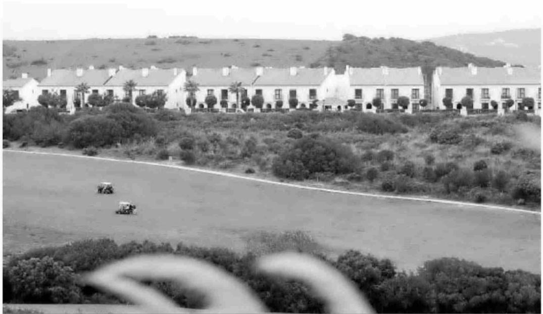
Vista parcial de la urbanización Alcaidesa.

El proceso sigue adelante y la firma del contrato se llevará a cabo en unos días