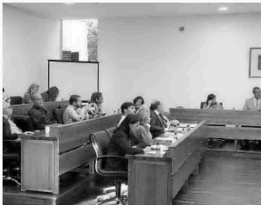
Imagen del pleno de Mancomunidad en el que se decidió el concurso.

caidesa es el decreto de Alcaldía con fecha de 27 de enero de 2005, en el que se recoge que el Ayuntamiento de La Línea procedía a la recepción de las redes de saneamiento y suministro de agua potable del sector ‘Alcaidesa Playa’. Para proceder a esta recepción fue necesario que el ingeniero municipal y la empresa Aqualia emitieran el correspondiente informe que constataba que las redes se encontraban en perfecto estado.