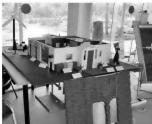
La maqueta de la casa bioclimática diseñada por la Escuela de San José.