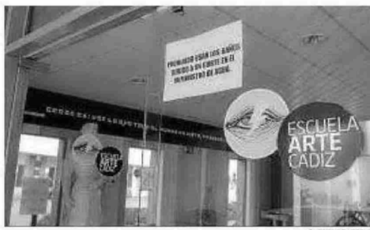
Cartel que se colocó el pasado martes en la Casa de las Artes.

El agua regresó ayer a la Casa de Las Artes, después de un día sin ella como consecuencia del cambio de titularidad del suministro, que hasta hace sólo unas semanas seguía dependiendo de la empresa constructora que edificó el equipamiento. Hasta el pasado martes, el centro educativo venía utilizando la acometida de