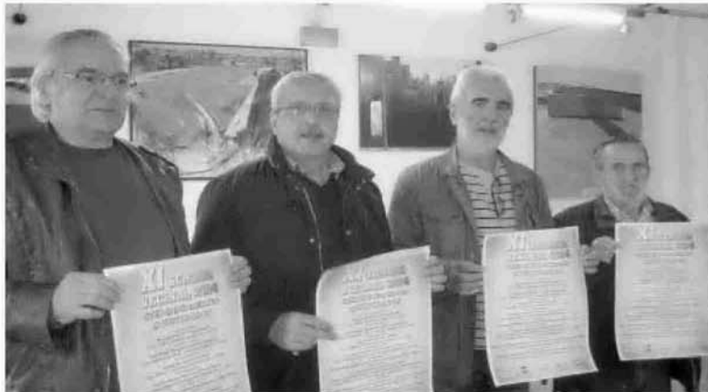
Representantes de Al-Zahara en la presentación de la XI Semana Vecinal.