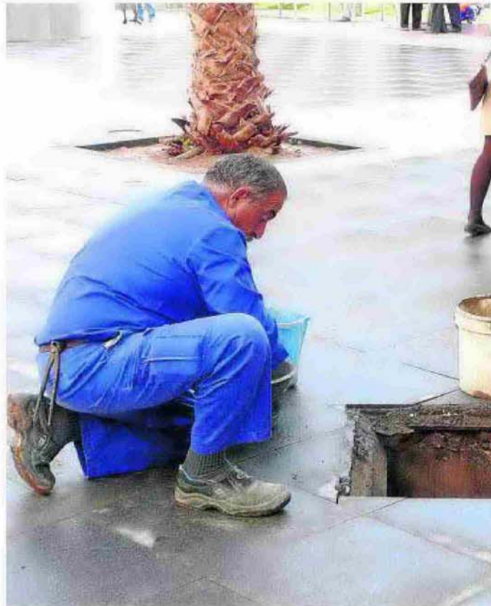
Desde 2015, las tareas de jardinería, alumbrado y mantenimiento los prestará directamente el Consistorio.

De este modo, y tal y como explicó el concejal, «además de no