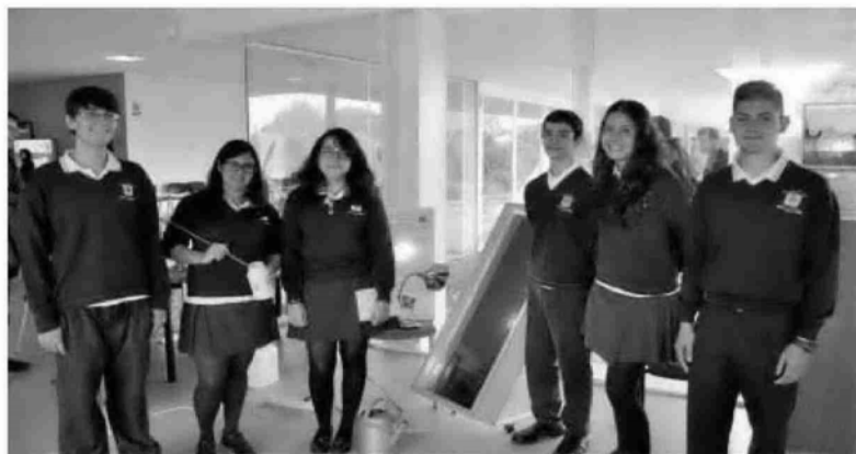
Alumnos de la Escuela de San José, en la presentación del proyecto en la Facultad de Ciencias.