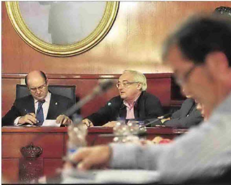
Momento del Pleno en el que la Corporación municipal aprobó las ordenanzas fiscales para el año 2015.