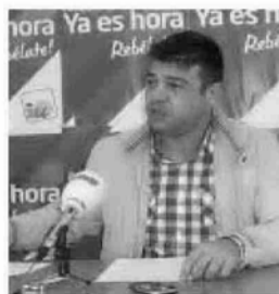
Javier Valderas, portavoz de IU.

de la ciudadanía". Según Valderas, "el caudal es tan pobre a determinadas horas que ni siquiera es suficiente para la activación de los calentadores, provocando en algunos casos la rotura de los mismos, y en otros, obligando a muchas personas a comprar termos eléctricos para poder ducharse en condiciones".