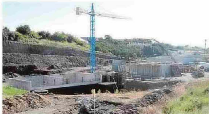
Aspecto que presentaban ayer las obras de la depuradora.

Sobre el terreno, en el paraje conocido como Aguahierro, ya son visibles tres depósitos y un aliviadero para el arroyo. También se ha ejecutado un colector para recoger las aguas de Maro. En las cuentas de 2016 tendrá consignados otros 10,4 millones. Las obras de la depuradora están ya a pleno rendimiento.