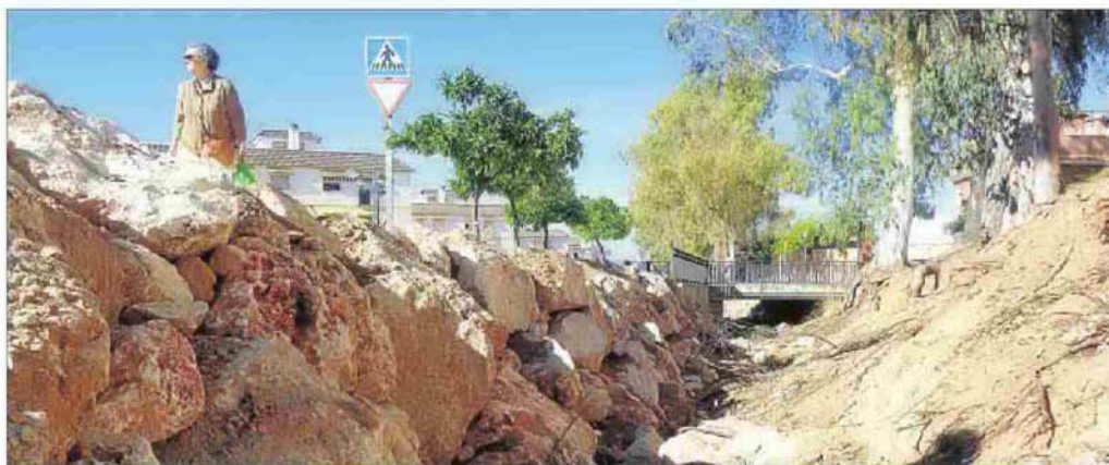
Una vista del arroyo de la Gorguera, que se desborda y provoca inundaciones cuando se producen fuertes precipitaciones.