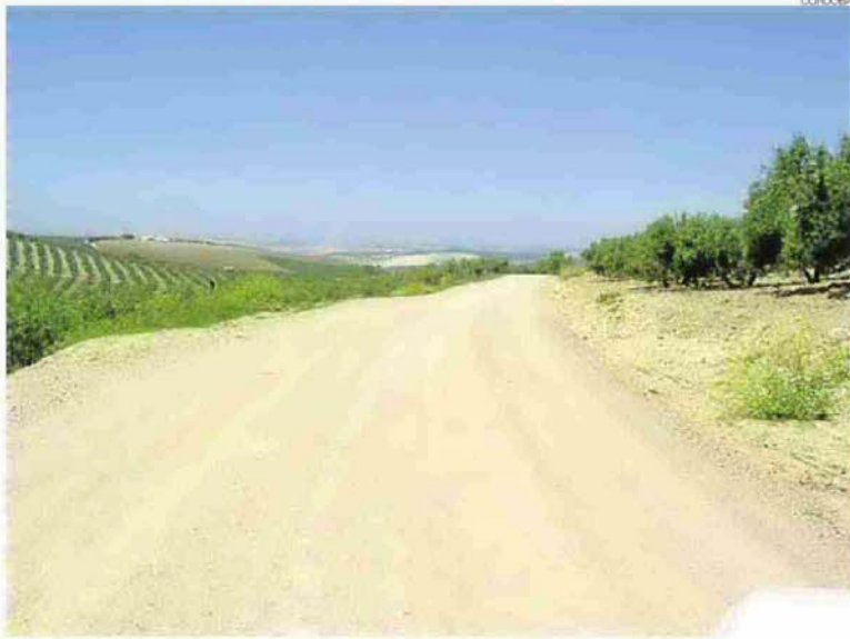
►► La actuación se lleva a cabo en todas las comarcas de la provincia.

La Junta de Andalucía invertirá 121.000 euros en cada munici-