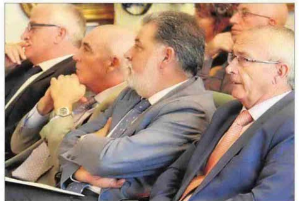
Directivos de Aljarafoesa, Huesna, Ecíja y Consorcio Provincial siguen las ponencias.