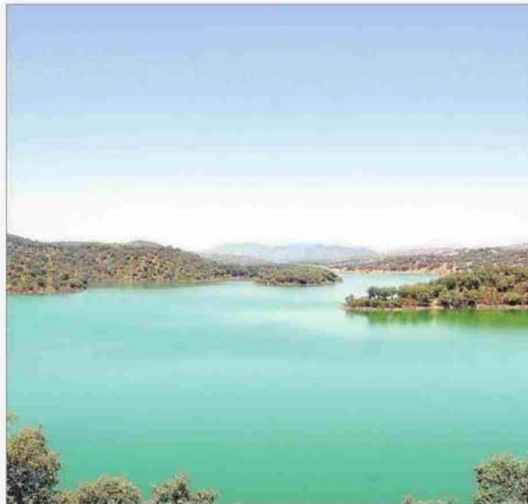
Vista general del embalse del Huesna.

El túnel del Huesna es un proyecto valorado en unos 25 millones de euros, está incluido en el esquema de temas importantes de la Confederación Hi-