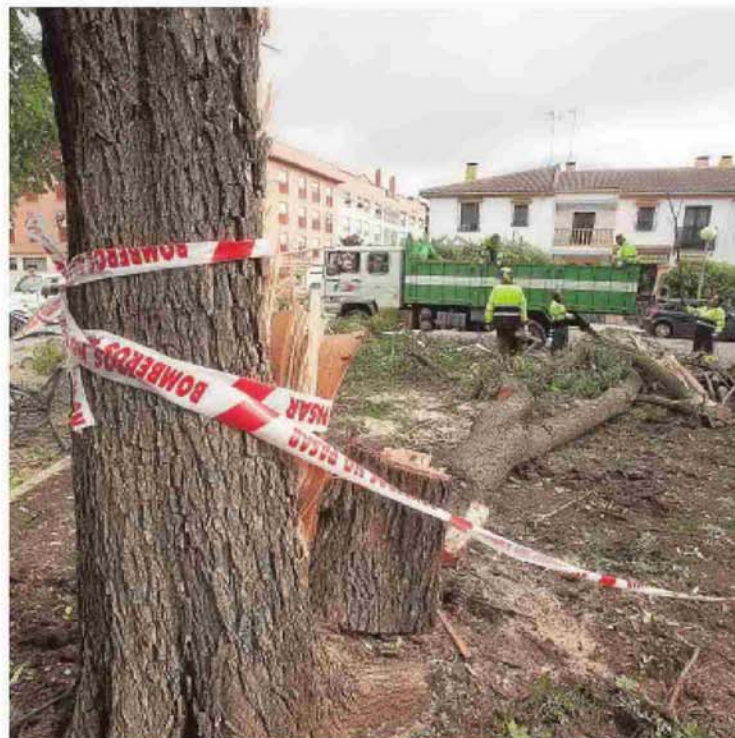
Técnicos municipales retirando ramas caídas

Los episodios más repetidos por viento fueron las caídas de ramas de árboles (en Carlos III y la avenida de Libia, entre otras zonas de la capital), desprendimientos de cornisas y tejas, así como daños en el mobiliario urbano. Por otro lado, las abundantes precipitaciones crearon balsas de agua y anegaciones puntuales.