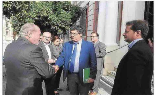
La casa de la provincia acogió durante dos días las jornadas.