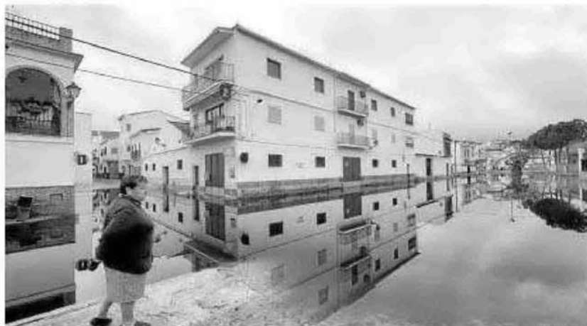
Inundaciones en el municipio sevillano de Badolatosa en marzo de 2013.

Al tener ya detectados estos puntos, actualmente la Confederación está dando los pasos previos para la diseñar los planes de gestión de riesgo de inundaciones para la demarcación del Gua-